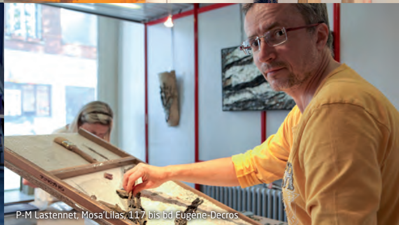
P-M Lastennet, Mosa'Lilas, 117 bis bd Eugène-Decros