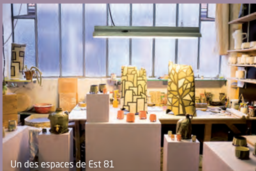
Un des espaces de Est 81

Avec trois céramistes, le sculpteur Antonin Heck a monté le collectif EST 81, implanté en face de Lilatelier.