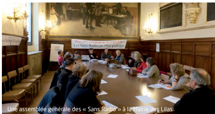
Une assemblée générale des « Sans Radio » à la Mairie des Lilas

+infos : sans.radio@laposte.net www.sansradio.org