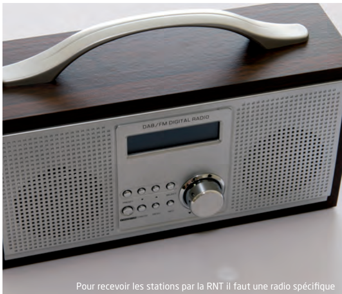
Pour recevoir les stations par la RNT il faut une radio spécifique

Depuis 2002, « les Sans Radio de l'Est parisien » se battent pour recevoir les stations de radio en FM rendues inaudibles par un émetteur, appartenant à TowerCast, installé au sommet des tours Mercuriales. Une expérimentation de la Radio Numérique Terrestre va atténuer cette injustice.