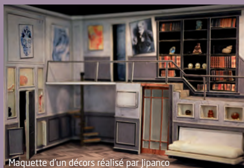
Maquette d'un décors réalisé par Jipanco

lesquels s'affairent entre sept et cinquante personnes, suivant les commandes. Des menuisiers (l'essentiel de l'équipe), des serruriers, de vrais ferronniers qui réalisent des structures en métal, des balcons, des peintres, des patineurs