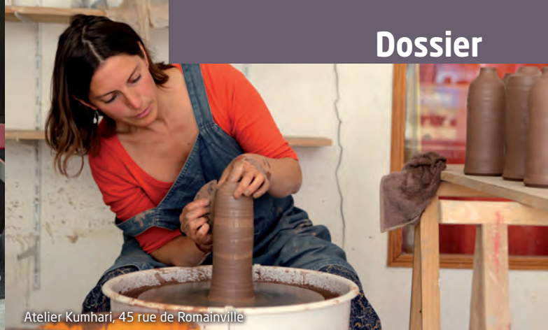
Atelier Kumhari, 45 rue de Romainville