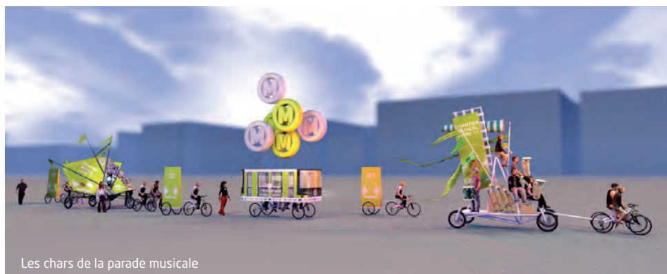
Les chars de la parade musicale

Une manifestation festive et musicale pour le lancement du chantier à proximité des futures stations