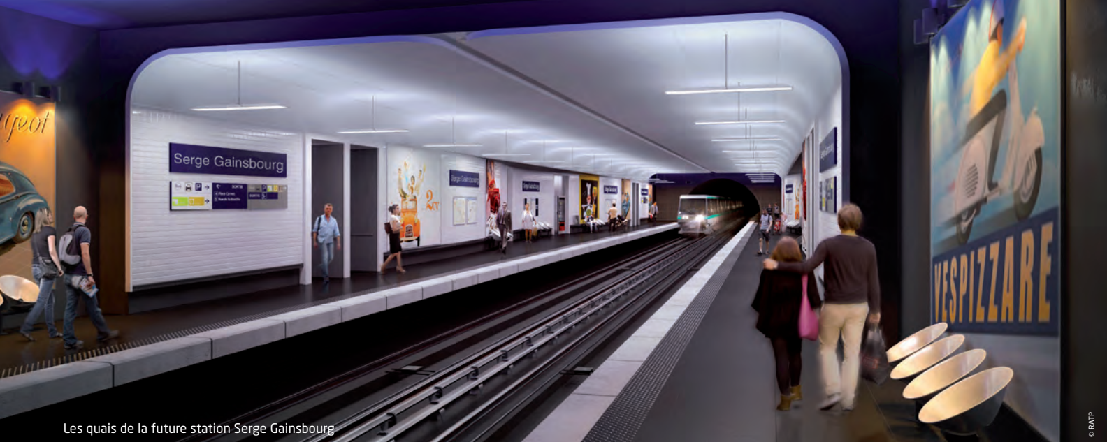
Les quais de la future station Serge Gainsbourg