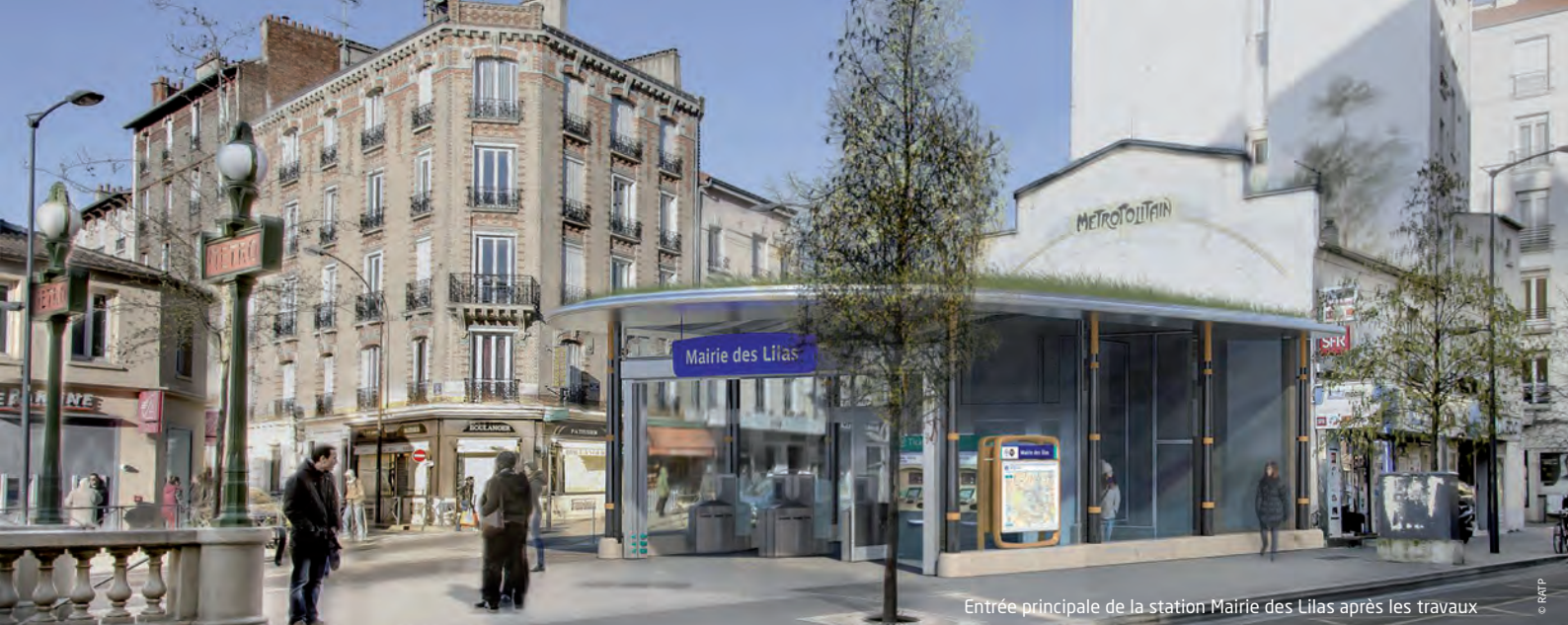
Entrée principale de la station Mairie des Lilas après les travaux