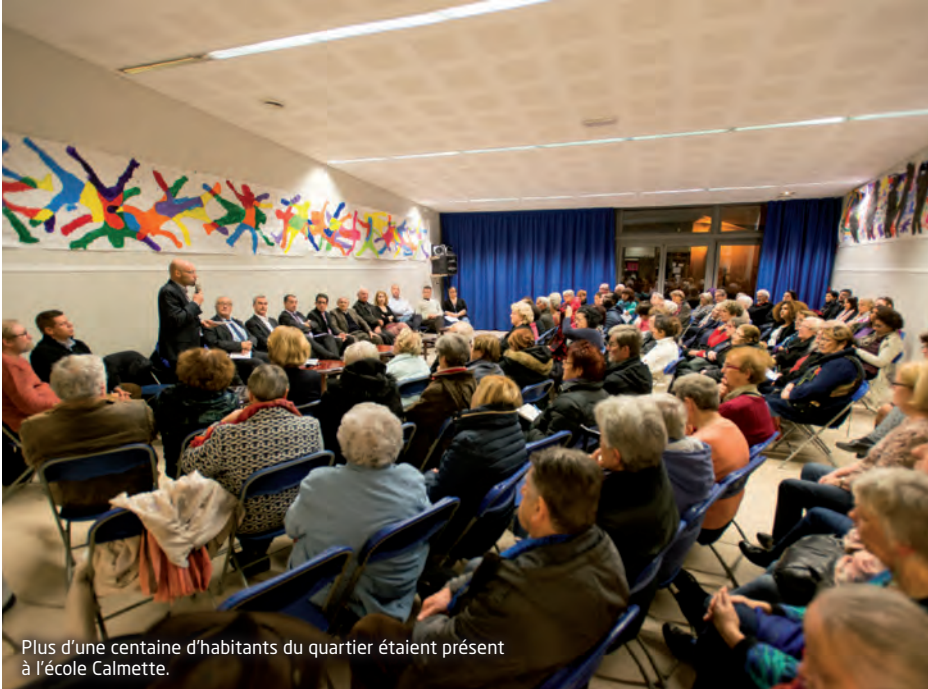
Plus d'une centaine d'habitants du quartier étaient présent à l'école Calmette.

A la demande des associations du quartier des Sentes, s'est tenue le mercredi 23 novembre à l'école Calmette, une réunion sur les questions de sécurité avec le Commissariat des Lilas, l'OPH 93, les associations et la municipalité. Le Maire a annoncé le recrutement d'éducateurs de rue et le lancement d'une campagne pour obtenir le renforcement des effectifs de police nationale du commissariat des Lilas.