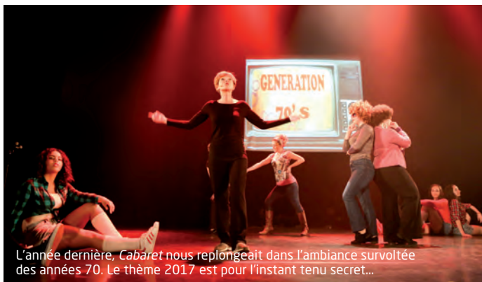
L'année dernière, Cabaret nous replongeait dans l'ambiance survoltée des années 70. Le thème 2017 est pour l'instant tenu secret...

Institution Lilasienne depuis 1970, Cabaret , le spectacle des cours de comédie musicale du centre culturel Jean-Cocteau, se construit déjà. Point d'étape.