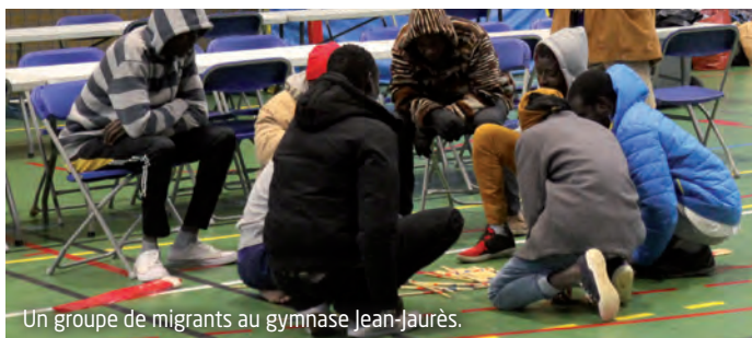
Un groupe de migrants au gymnase Jean-Jaurès.

La Ville des Lilas a accueilli une partie des réfugiés expulsés du campement de la place Stalingrad. L'occasion pour les Lilasiens de faire la preuve de leur solidarité et de leur générosité... Moins de trois semaines plus tard, ils ont été orientés vers d'autres lieux d'accueil mieux adaptés.