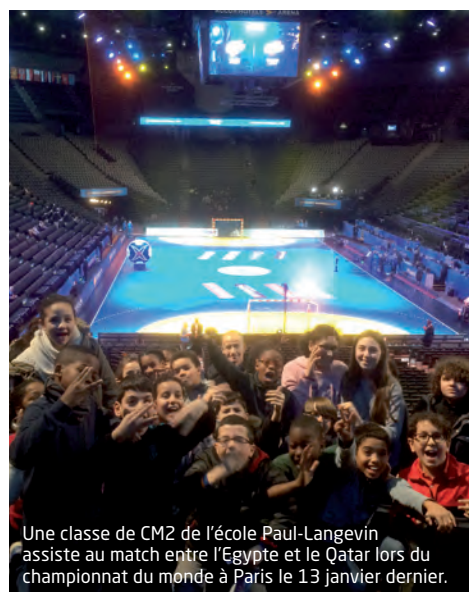
Une classe de CM2 de l'école Paul-Langevin assiste au match entre l'Égypte et le Qatar lors du championnat du monde à Paris le 13 janvier dernier.