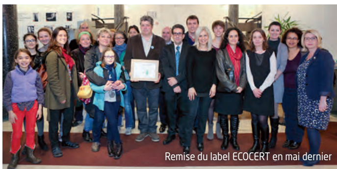
Remise du label ECOCERT en mai dernier

Le collectif « Pas d'usine ! On cuisine ! » rassemble des parents d'élèves soucieux de réfléchir aux questions relatives à la restauration scolaire afin d'en faire progresser la qualité et pour la rendre plus durable.