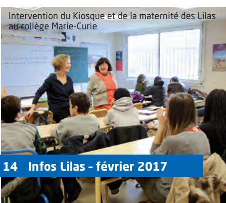
Intervention du Kiosque et de la maternité des Lilas au collège Marie-Curie

Le Ville intervient régulièrement à la demande du collège et du lycée sur les questions de prévention. Au lycée Paul-Robert, le Kiosque, en partenariat avec le CMS et le service jeunesse, interviendra cette année auprès des classes de Seconde pour prévenir les risques liés au cannabis et à l'alcool (permanences régulières lors des pauses déjeuner, utilisation de petites scénettes théâtrales pour