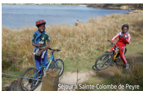
Séjour à Sainte-Colombe de Peyre

+ d'infos : Service Education / Square Georges Valbon (bât. situé derrière la mairie) 01 72 03 17 15