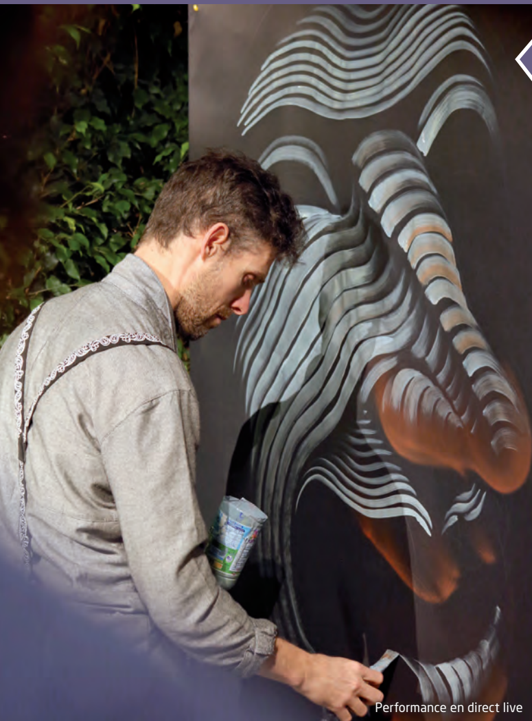
Performance en direct live