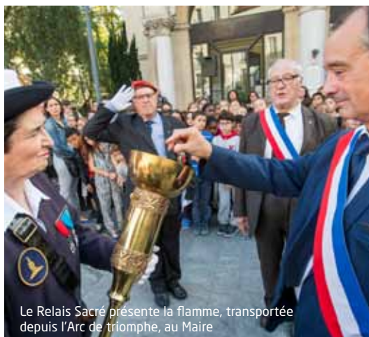
Le Relais Sacré présente la flamme, transportée depuis l'Arc de triomphe, au Maire

La Ville a accueilli la flamme de la Nation, allumée sous l'Arc de triomphe et portée par le Relais Sacré . Elle a parcouru la ville du parvis du théâtre du Garde-Chasse jusqu'à celui de la Mairie en passant par le carré militaire des Lilas, accompagnée par l'Union Musicale Lilasienne, les associations du monde combattant et les enfants des écoles qui ont porté les drapeaux et allumé des bougies devant le monument aux morts. Devant la Mairie, 150 ballons bleus, blancs et rouges ont été lancés dans le ciel lilasien par 150 élèves.