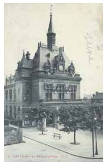
La place de la Mairie et l'Hôtel de Ville au début du XX ème siècle

quelques mois la Mairie en 2012 pour rejoindre le musée d'Orsay où se tenait une rétrospective de l'œuvre de Jean-Léon Gérôme. A la place, le musée avait installé une reproduction numérique grandeur nature. Une reproduction dorénavant visible au Centre Municipal de Santé des Lilas.