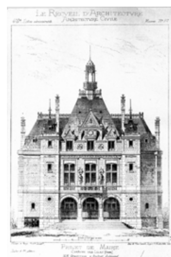
Un des nombreux projets non retenus