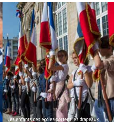
Les enfants des écoles portent les drapeaux