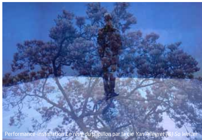
Performance-installation Le rêve du papillon par la cie Yan Allegret (&) So Weiter

De nombreux autres rendez-vous sont à découvrir dans le programme de la manifestation , encarté au centre de ce journal.