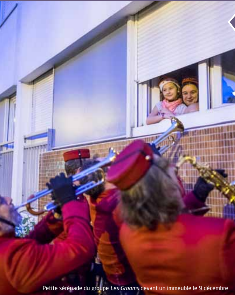
Petite sérénade du groupe Les Grooms devant un immeuble le 9 décembre