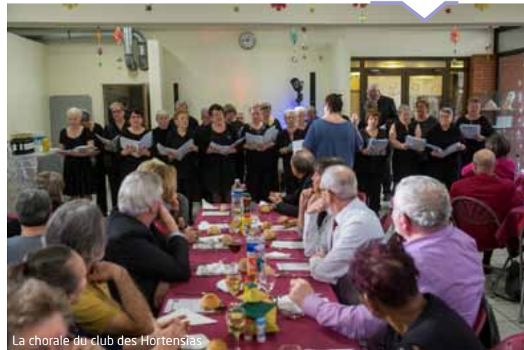
La chorale du club des Hortensias

Un déjeuner à la fois festif et très chaleureux au club des Hortensias avec notamment le concert de la chorale du club pour mettre tout ce petit monde en appétit.