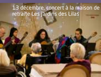
13 décembre, concert à la maison de retraite Les Jardins des Lilas

Belle réussite pour ce premier Noël du quartier des Sentes organisé conjointement par la Ville et l'association Mieux Vivre au Quartier des Sentes . Le 9 décembre, après l'inauguration du sapin au son du groupe loufoque et musical Les Grooms , chacun a pu se réchauffer d'un verre de vin chaud et écouter un groupe de jazz, avant de participer à une expérience sonore grâce à l'artiste Armel Veilhan. Pendant la semaine, des chorales d'enfants, celle des Hortensias, des professeurs du conservatoire, une conteuse de La Voix du Griot se sont produits dans les écoles et maisons de retraite du quartier. Le dernier week-end a été particulièrement animé avec un atelier culinaire, un repas partagé, le tirage de la tombola et les derniers concerts au café Le Royal , un DJ à l'espace Louise-Michel. Un film, Regards sur les Sentes , réalisé avec les images des habitants, témoigne de cette belle manifestation.