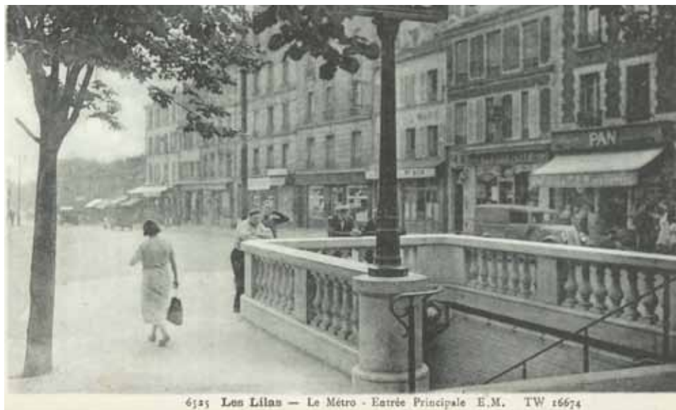
6325 Les Lilas — Le Métro - Entrée Principale E.M. TW 16674

Petites et grandes histoires du métro aux Lilas.