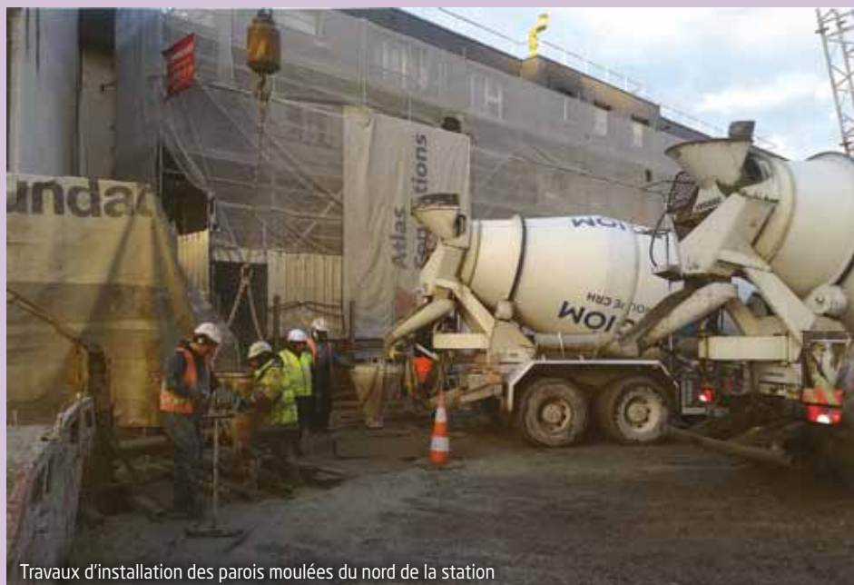
Travaux d'installation des parois moulées du nord de la station

Le chantier s'arrête pendant les fêtes et redémarrera début janvier 2018.