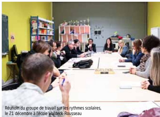
Réunion du groupe de travail sur les rythmes scolaires, le 21 décembre à l'école Waldeck-Rousseau

Après la réunion publique du 28 novembre au gymnase Liberté, la concertation se poursuit pour décider comment s'organiseront les temps scolaires et périscolaires à la rentrée prochaine.