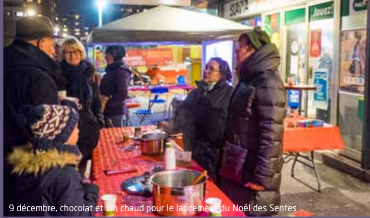
9 décembre, chocolat et vin chaud pour le lancement du Noël des Sentes