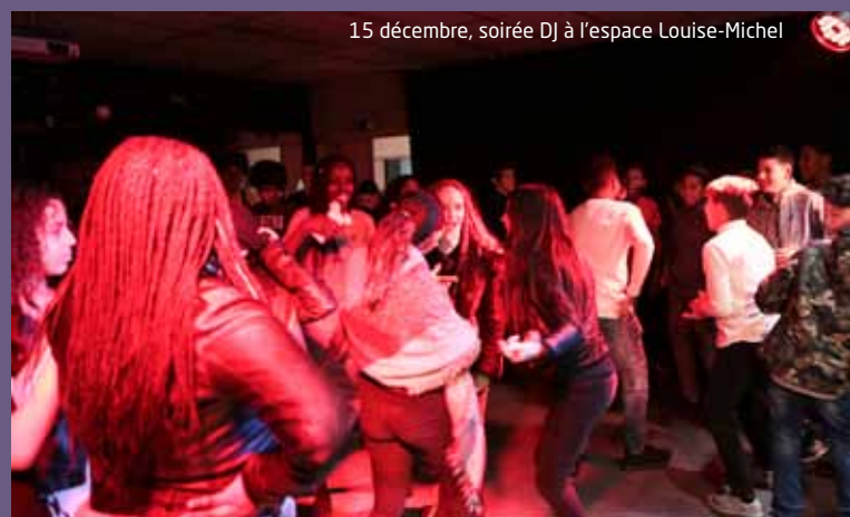
15 décembre, soirée DJ à l'espace Louise-Michel