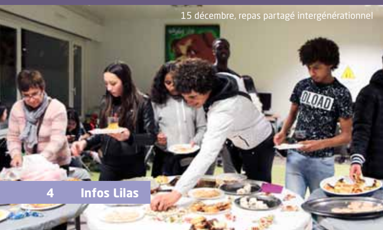
15 décembre, repas partagé intergénérationnel