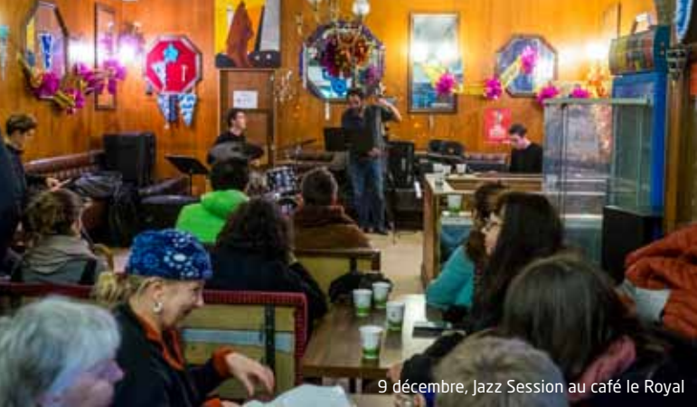
9 décembre, Jazz Session au café Le Royal