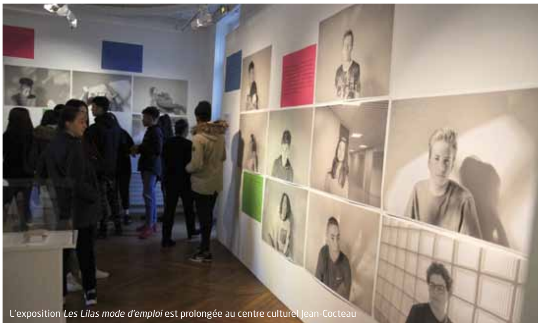
L'exposition Les Lilas mode d'emploi est prolongée au centre culturel Jean-Cocteau

12 décembre, les élèves des Secondes 5, 6 et 7 du lycée Paul-Robert se rendent à l'espace culturel d'Anglemont pour découvrir leurs photos et textes, intégrés à l'exposition Les Lilas mode d'emploi réalisée avec les photographes Bertrand Meunier et Alain Willaume du collectif Tendance floue .