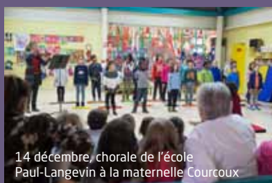
14 décembre, chorale de l'école Paul-Langevin à la maternelle Courcoux