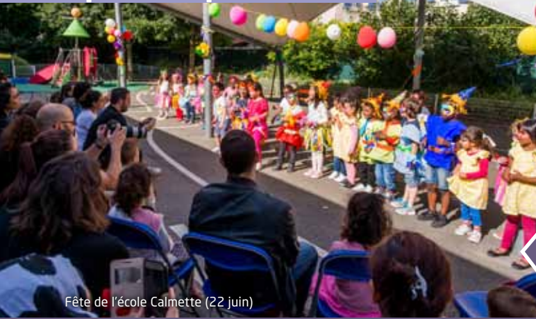
Fête de l'école Calmette (22 juin)