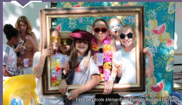
Fête de l'école élémentaire Romain-Rolland (30 juin)