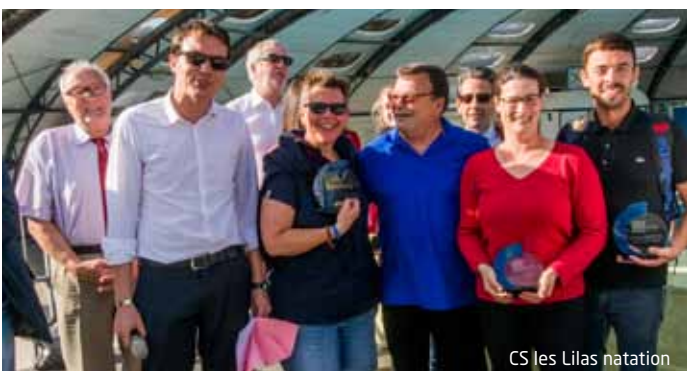
CS les Lilas natation