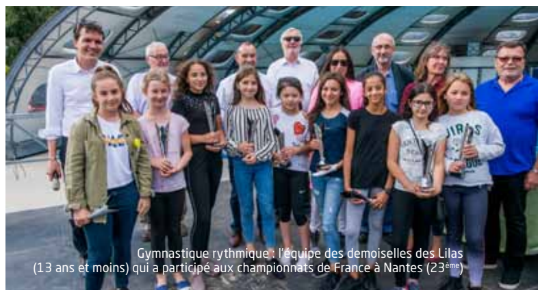
Gymnastique rythmique : l'équipe des demoiselles des Lilas (13 ans et moins) qui a participé aux championnats de France à Nantes (23 ème )