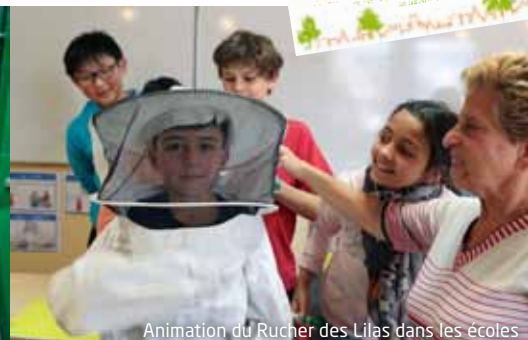
Animation du Rucher des Lilas dans les écoles

Dans le cadre de la huitième édition des Assises françaises de la biodiversité, l'association des Eco Maires a sélectionné le miel produit aux Lilas par l'association Le Rucher des Lilas comme l'un des meilleurs du territoire. Outre la qualité gustative de miel lilasien, c'est l'ensemble des actions pédagogiques et de sensibilisation menées par le Rucher des Lilas en partenariat avec la Ville qui est mis en avant et récompensé. Alors que l'association se