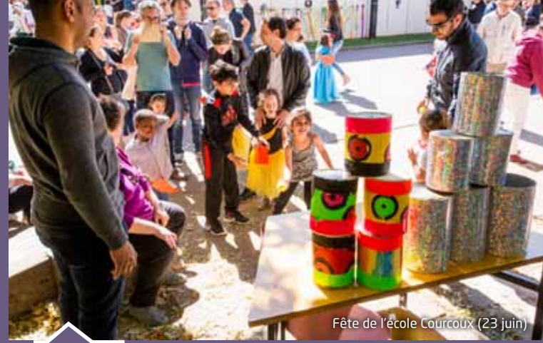
Fête de l'école Courcoux (23 juin)