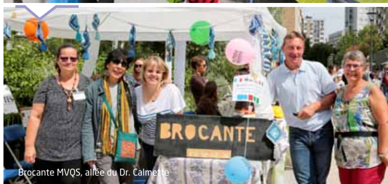
Brocante MVQS, allée du Dr. Calmette