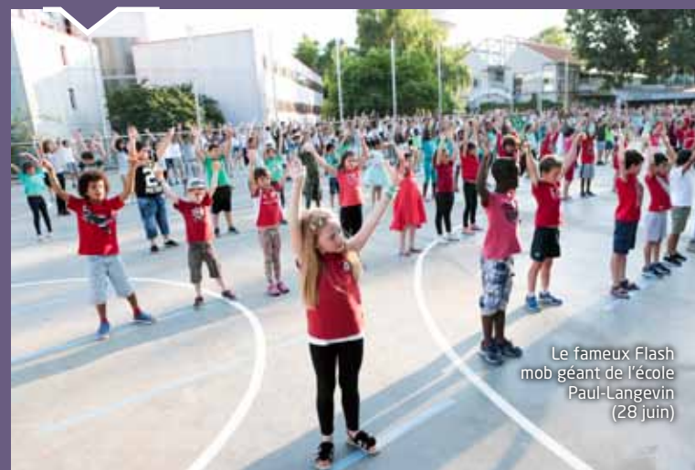
Le fameux Flash mob géant de l'école Paul-Langevin (28 juin)