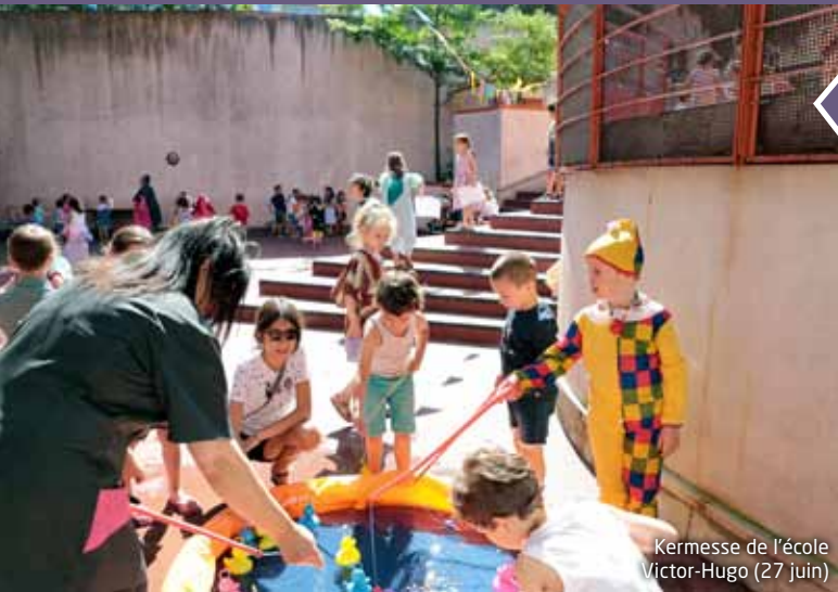
Kermesse de l'école Victor-Hugo (27 juin)