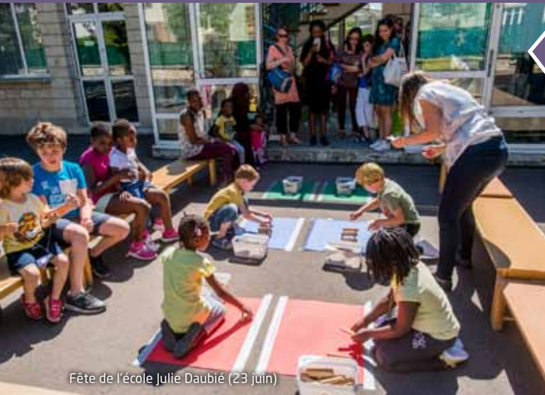
Fête de l'école Julie Daubié (23 juin)

Retour en images sur les fêtes d'écoles qui se sont déroulées au mois de juin.