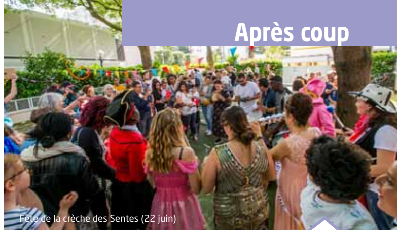
Fête de la crèche des Sentes (22 juin)