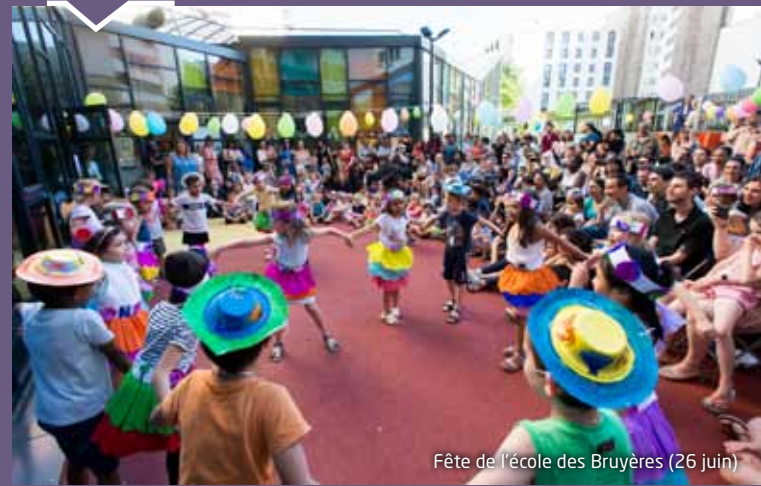
Fête de l'école des Bruyères (26 juin)