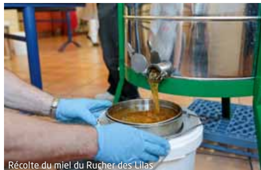
Récolte du miel du Rucher des Lilas