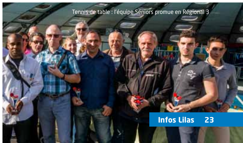
Tennis de table : l'équipe Séniors promue en Régional 3