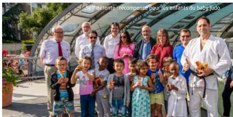
Self détente : récompense pour les enfants du baby Judo