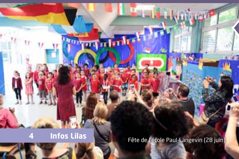
Fête de l'école Paul-Langevin (28 juin)