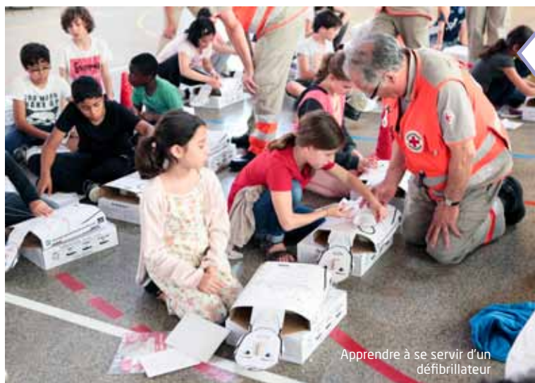
Apprendre à se servir d'un défibrillateur