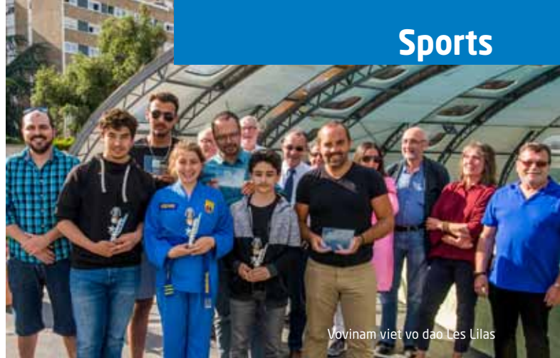
Vovinam viet vo dao Les Lilas