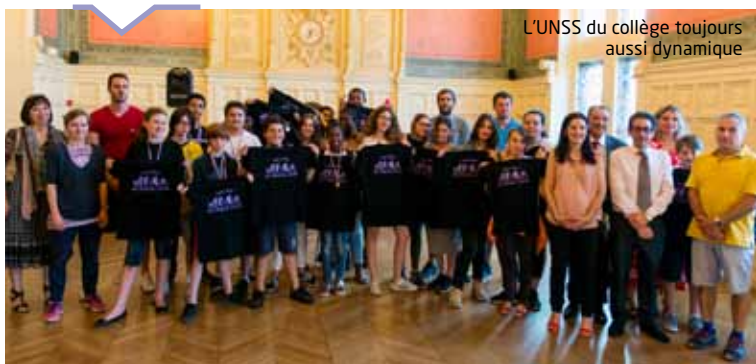
L'UNSS du collège toujours aussi dynamique