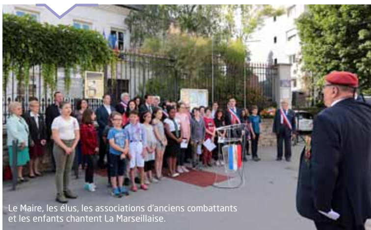
Le Maire, les élus, les associations d'anciens combattants et les enfants chantent La Marseillaise.