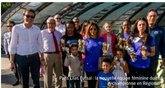
Paris Lilas Futsal : la nouvelle équipe féminine du club championne en Régional 2