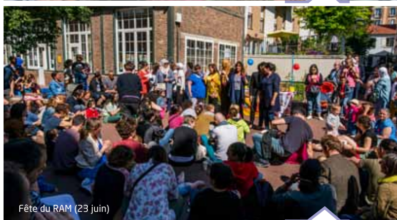
Fête du RAM (23 juin)