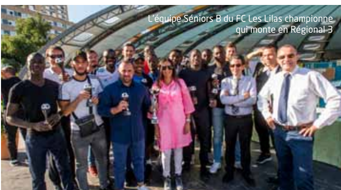
L'équipe Séniors B du FC Les Lilas championne qui monte en Régional 3