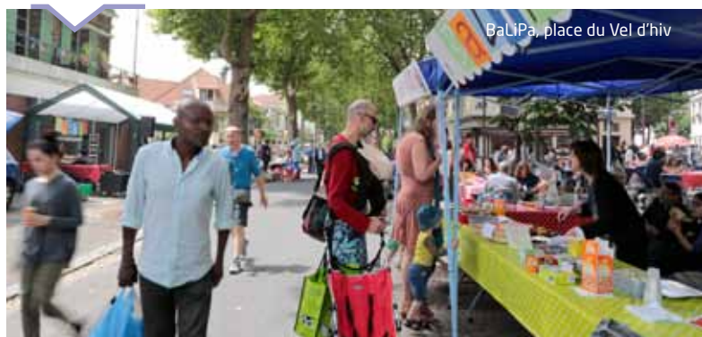
BaLiPa, place du Vel d'hiv