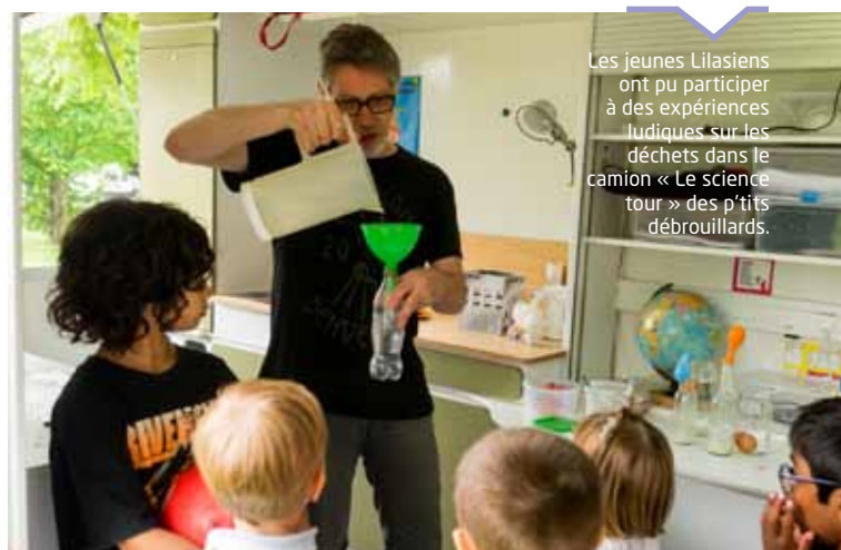
Les jeunes Lilasiens ont pu participer à des expériences ludiques sur les déchets dans le camion « Le science tour » des p'tits débrouillards.

De nombreuses associations, dont le Rucher des Lilas , Tous pour un Vélo , Electrons solaire 93 , Le potager Liberté , Mieux se déplacer à bicyclette , Le potager des Lilas , Activille , Les petits débrouillards , MVE , La Courgette solidaire , le collectif Eau-Ile-de-France , étaient présentes au parc Lucie-Aubrac pour répondre aux questions des Lilasiens.