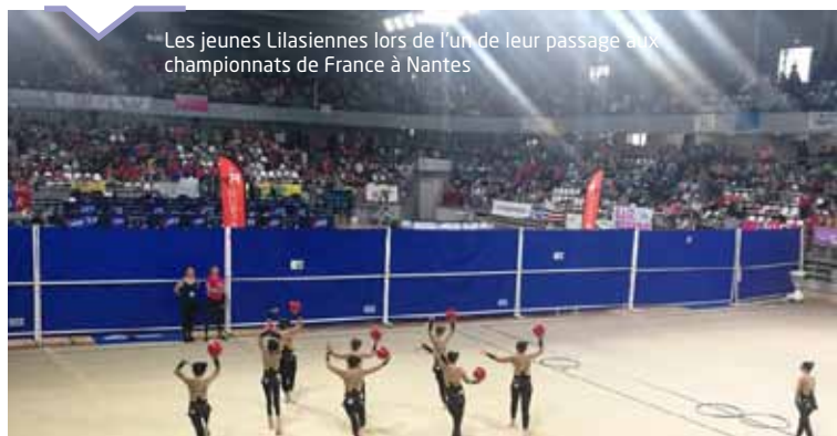
Les jeunes Lilasiennes lors de l'un de leur passage aux championnats de France à Nantes

L'équipe de 10 jeunes filles de l'association Lilasienne a terminé à une probante 23 ème place dans la catégorie 13 ans et moins.