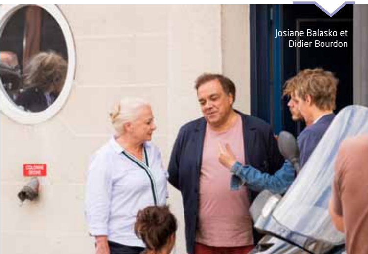
Josiane Balasko et Didier Bourdon

Sabordage ! C'était le titre de cette spectaculaire performance de cirque de la compagnie La mondiale générale avec ses 4 auteurs acrobates qui jouent sur l'équilibre et les situations absurdes. Un spectacle apprécié par le nombreux public.