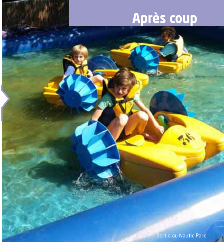
Sortie au Nautic Park