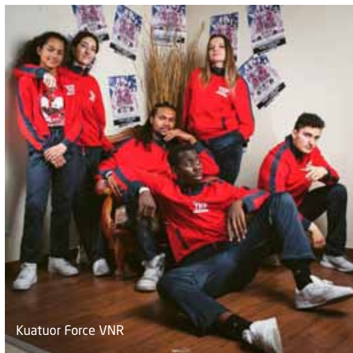
Kuatuor Force VNR

■ Le 29 septembre à partir de 17h30, théâtre du Garde-Chasse, tarif unique 5€