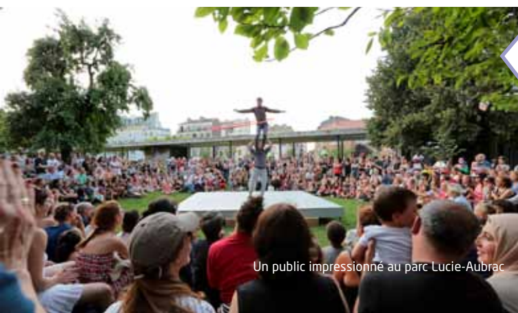
Un public impressionné au parc Lucie-Aubrac