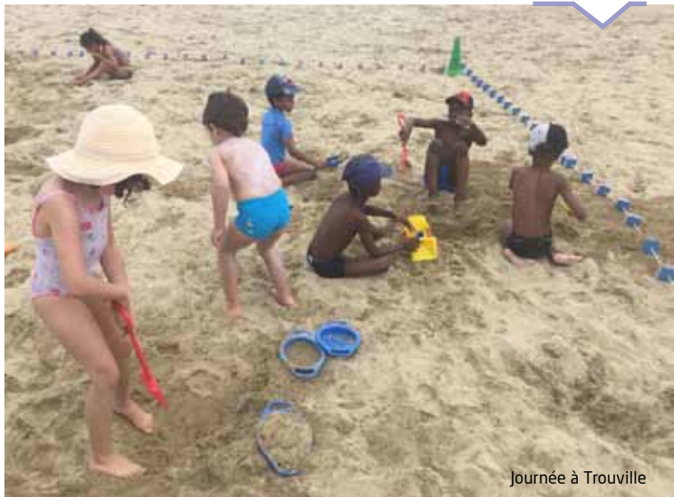
Journée à Trouville

Les enfants qui ont fréquenté le centre de loisirs pendant l'été ne se sont pas ennuyés. La preuve en images.