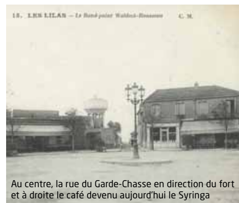
Au centre, la rue du Garde-Chasse en direction du fort et à droite le café devenu aujourd'hui le Syringa

En 1987, la Ville ouvre l'espace culturel d'Anglemont dans les bâtiments de l'institution Gay pour regrouper le conservatoire (Gabriel-Fauré), un centre culturel (Jean-Cocteau) et une bibliothèque (André-Malraux). Un auditorium et une salle d'expositions permettent de développer la fibre artistique des jeunes Lilasiens. Et, chaque année, le premier week-end de septembre, se tient l'incontournable Forum de rentrée, rendez-vous annuel de toutes les énergies associatives.