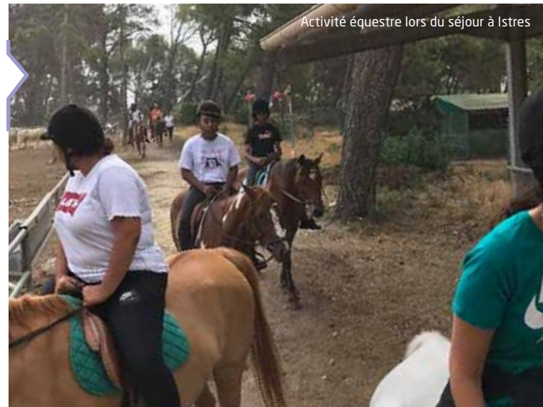
Activité équestre lors du séjour à Istres