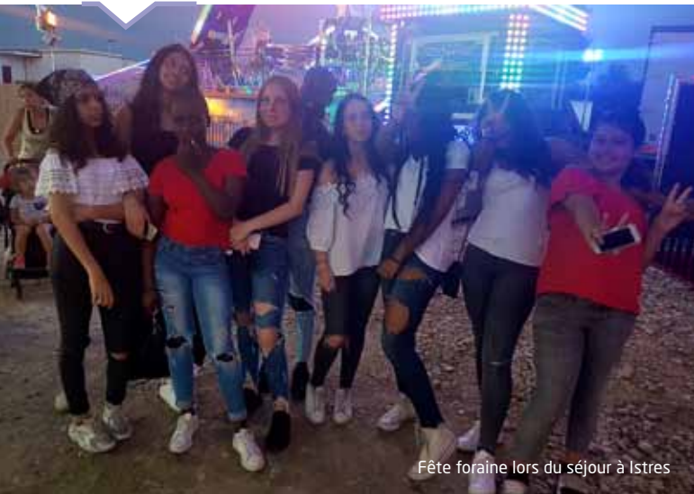
Fête foraine lors du séjour à Istres