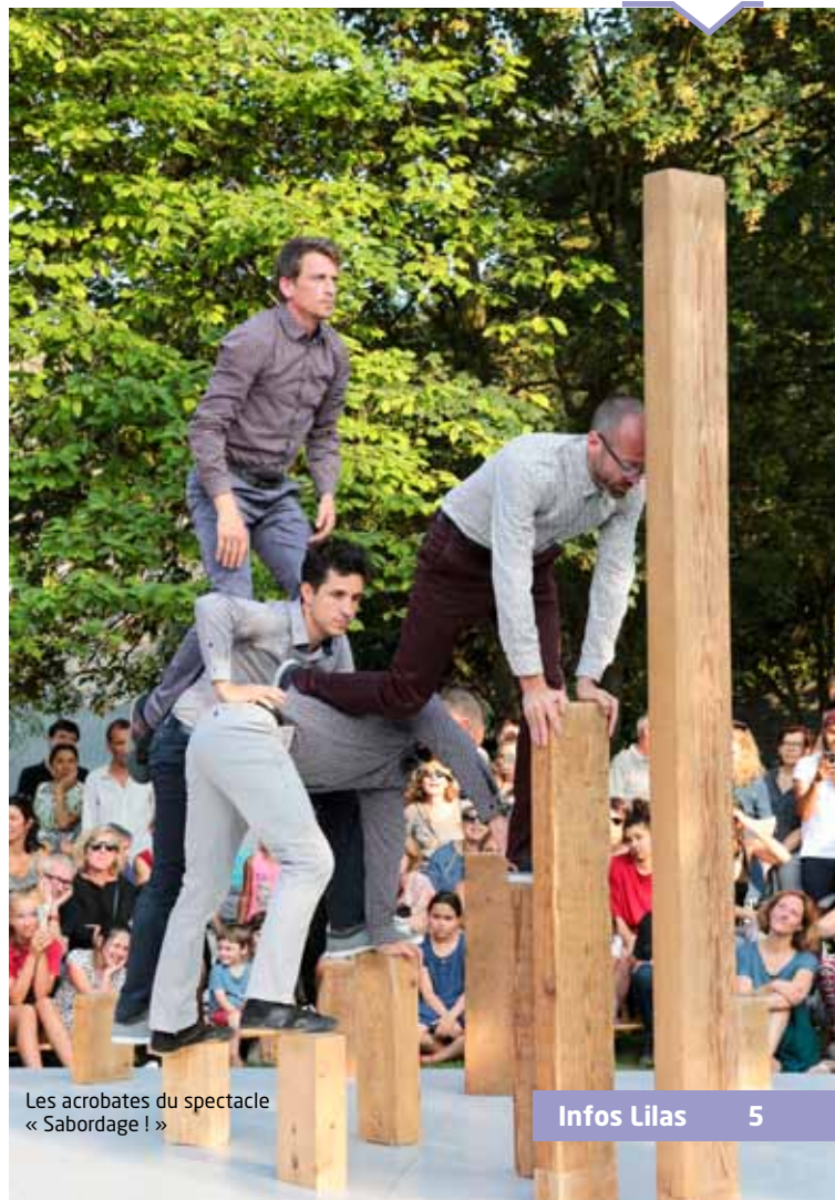
Les acrobates du spectacle « Sabordage ! »