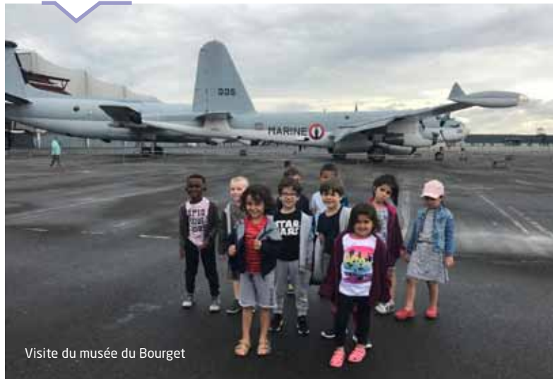
Visite du musée du Bourget