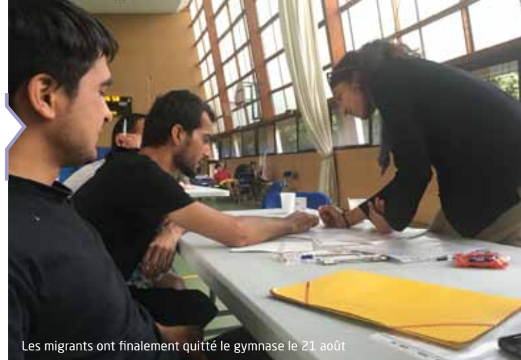
Les migrants ont finalement quitté le gymnase le 21 août

Entre piscine, VTT, bowling, karting, paintball, parc Astérix, grands jeux à thème, séjour à Istres..., les jeunes inscrits au service jeunesse ont goûté aux joies de nombreuses activités cet été.