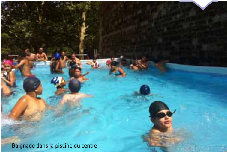
Baignade dans la piscine du centre