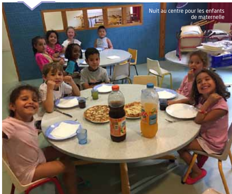
Nuit au centre pour les enfants de maternelle