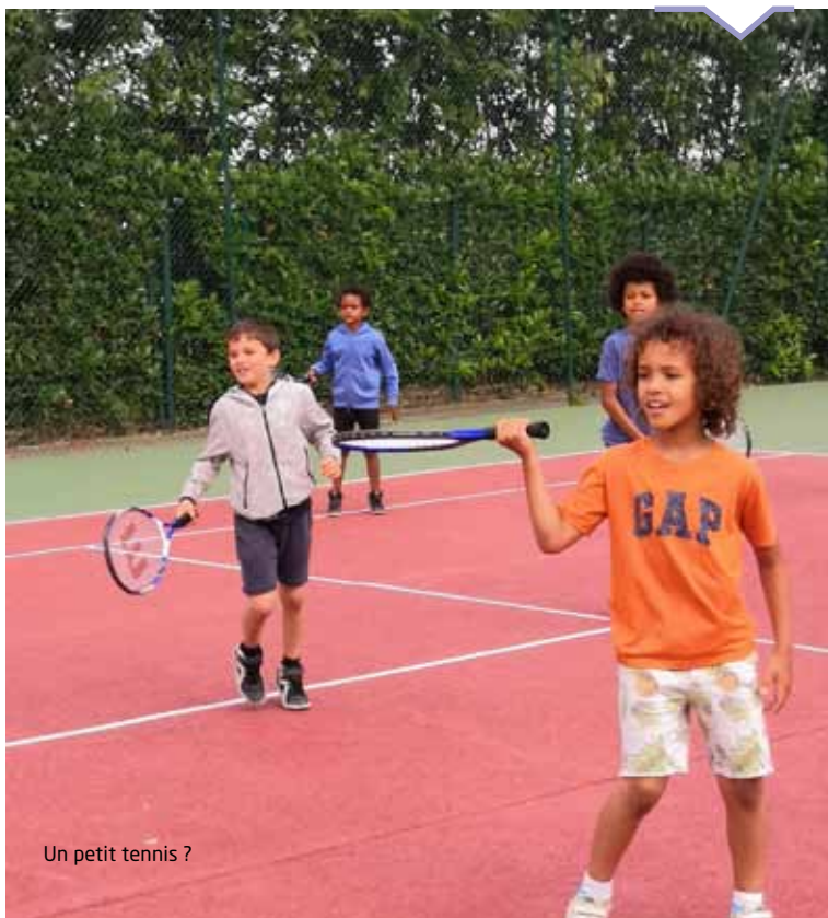
Un petit tennis ?