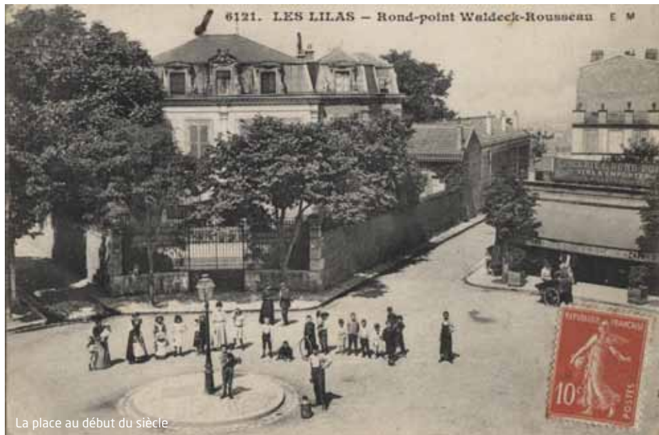
La place au début du siècle

Au sommet de l'ancien village de Belleville, dans le bois de Bouleaux, il y a un plateau, avec un grand carrefour en étoile. Il s'est appelé successivement place du Rond-Point, du Tapis Vert, Waldeck-Rousseau, Stalingrad et depuis 1970, Charles-de-Gaulle.