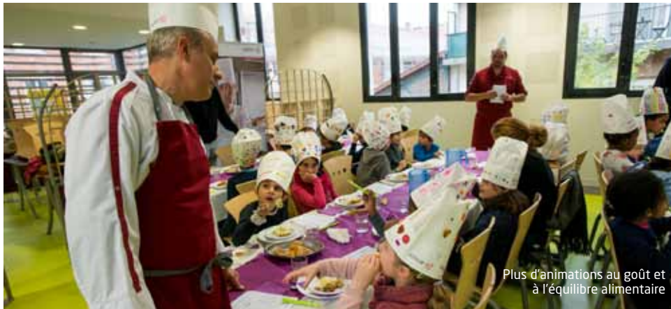
Plus d'animations au goût et à l'équilibre alimentaire

Toujours animée par la volonté d'offrir une restauration scolaire de qualité et le souci du développement durable, la Ville des Lilas propose des innovations dans ses restaurants scolaires cette année.