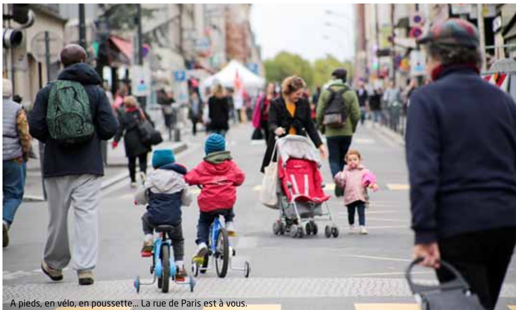
A pieds, en vélo, en poussette... La rue de Paris est à vous.

La Ville des Lilas participe à la Journée sans voiture initiée par la Ville de Paris. Le dimanche 16 septembre, la rue de Paris sera rendue aux piétons de 9h à 18h. Une occasion de faire la démonstration qu'avec une circulation automobile moindre, la ville est plus agréable à vivre.