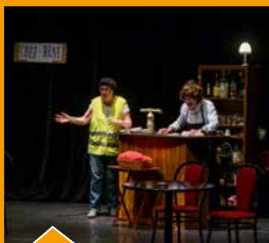
L'atelier théâtre du club des Hortensias présente sa nouvelle pièce, « Chez René » au théâtre du Garde-Chasse.