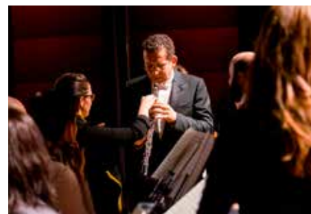
En décembre 2015, l'équipe du film Radin , avec Dany Boon, a tourné pendant une semaine au théâtre du Garde-Chasse (toutes les scènes de concert du film). Dany Boon y joue un musicien particulièrement pingre.

Oui décidément, entre Les Lilas et le cinéma, le lien est fort !