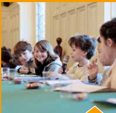
1 ère réunion du Conseil des élèves citoyens : le début d'un riche travail sur le thème de la solidarité.

La communauté éducative choisit de revenir à la semaine de 4 jours. La Ville a proposé à toutes les composantes de la communauté éducative de voter. un consensus s'est dégagé.