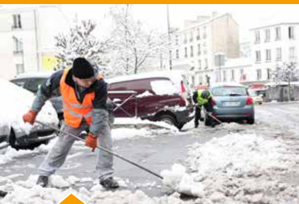
Début février, Les Lilas sous la neige : les services municipaux sont sur le terrain.

La manifestation Cultures d'Hivers fait cap sur la Tunisie. Ici, le grand bal tunisien en Mairie.