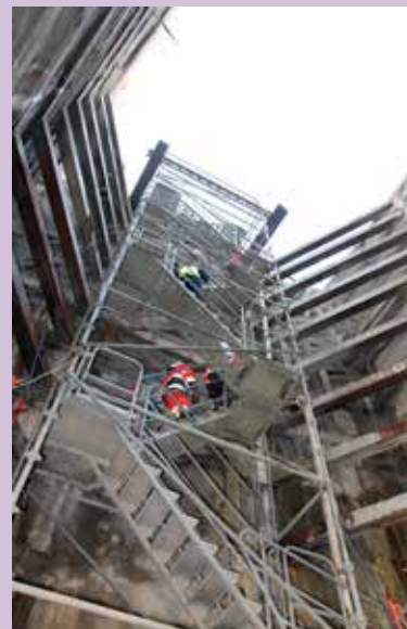
L'escalier de desserte du puits pendant la durée des travaux.