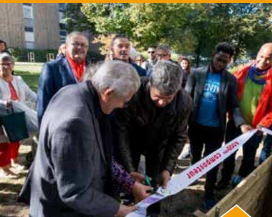
Inauguration du composteur collectif au quartier des Sentes.

Khiasma, installé aux Lilas depuis 2004, est contraint de fermer ses portes notamment du fait de la baisse drastique des financements de la région IDF. La Ville souhaite que le lieu puisse continuer à faire perdurer l'esprit de l'association.