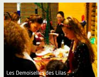
Les Ddemoiselles des Lilas