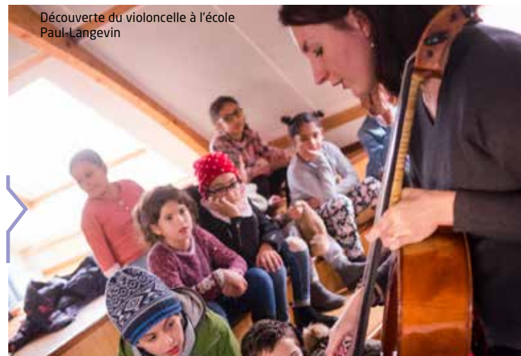
Découverte du violoncelle à l'école Paul-Langevin

Les bénéfices de cette soirée, organisée par la Ville et le Lions Club au théâtre du Garde-Chasse, ont été reversés à l'association Enfants, cancer, santé .