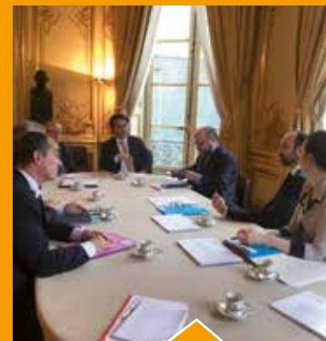
Le Maire est reçu par le Premier Ministre pour un échange sur l'avenir du Grand Paris.