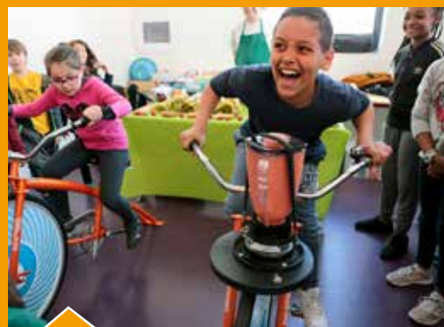
Animation originale à l'école Romain-Rolland pour sensibiliser les enfants à l'importance des fruits dans l'alimentation : les élèves ont pédalé pour confectionner des smoothies.