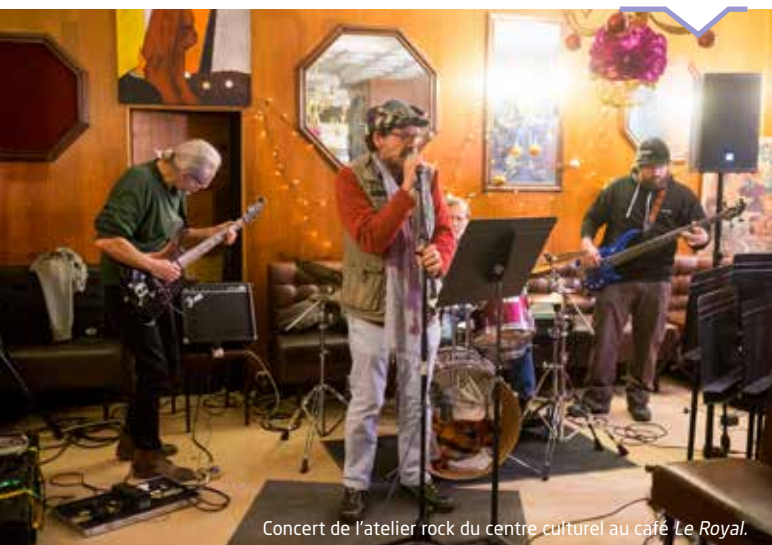
Concert de l'atelier rock du centre culturel au café Le Royal .