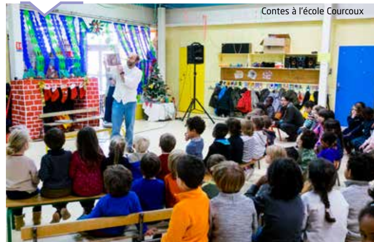
Contes à l'école Courcoux