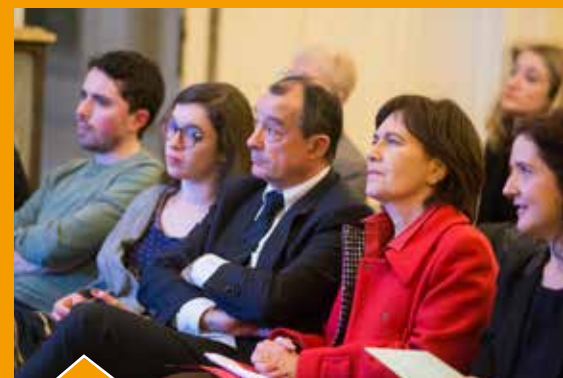
Les Lilas s'engagent pour l'égalité femmes – hommes à l'occasion de la journée internationale des droits des femmes avec notamment un débat en Mairie en présence de Laurence Rossignol, ancienne Ministre chargée des droits des femmes.