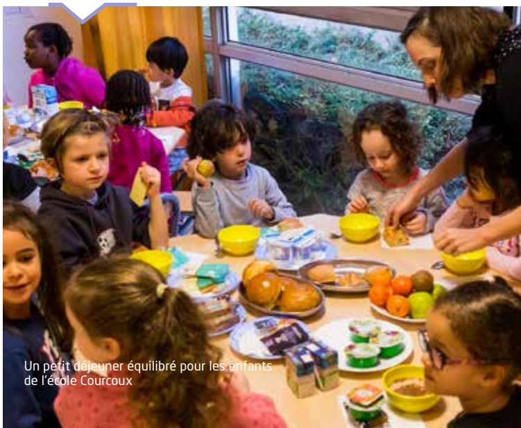
Un petit déjeuner équilibré pour les enfants de l'école Courcoux

Régulièrement dans les écoles, des animations ont lieu autour de l'équilibre alimentaire ou du développement durable. Ainsi, une animation « petit déjeuner » s'est tenue à la maternelle Courcoux et une sur le commerce équitable à l'école élémentaire Romain-Rolland.