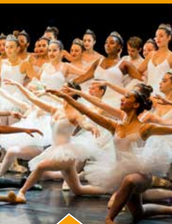
Le théâtre du Garde-Chasse fait salle comble pour le traditionnel gala de l'Etoile d'Or.