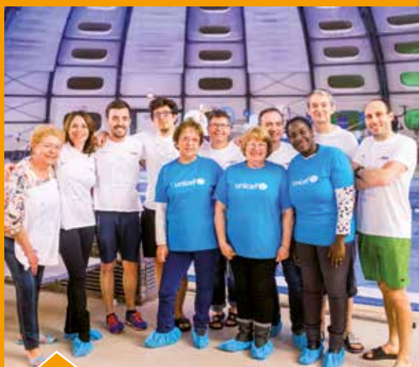
A la piscine des Lilas, le CSL Natation participe à la Nuit de l'eau au profit de l'UNICEF.

Le Maire participe à la manifestation pour rendre aux piétons les voies sur berges, au côté de la Maire de Paris, Anne Hidalgo