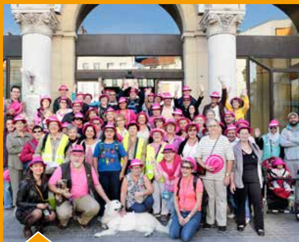
Les Lilasiens « marchent pour la santé » afin de promouvoir le dépistage du cancer du sein.