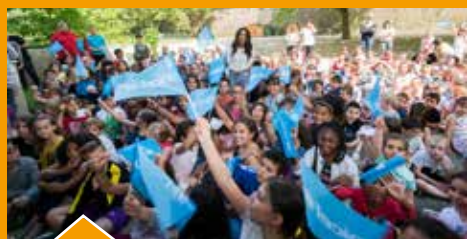
Avec l'UNICEF, à l'occasion d'UNIDAY, Nilusi, chanteuse des Kids United, a échangé avec les jeunes des Lilas au service jeunesse, sur le parvis de la Mairie et au centre de loisirs (photo).