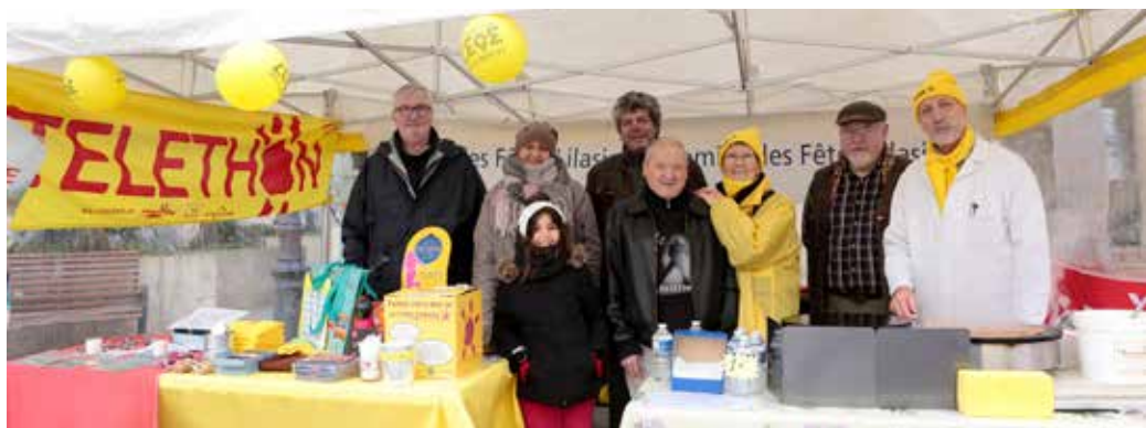
Le stand du Comité des fêtes lilasien.

Pour les 10h en rollers, les différents participants ont effectué 9 000 tours de 77 mètres de longueur, soit un total de 693 km. Un peu moins que l'année dernière, mais beau résultat quand même.