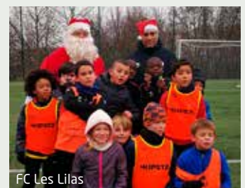
FC Les Lilas