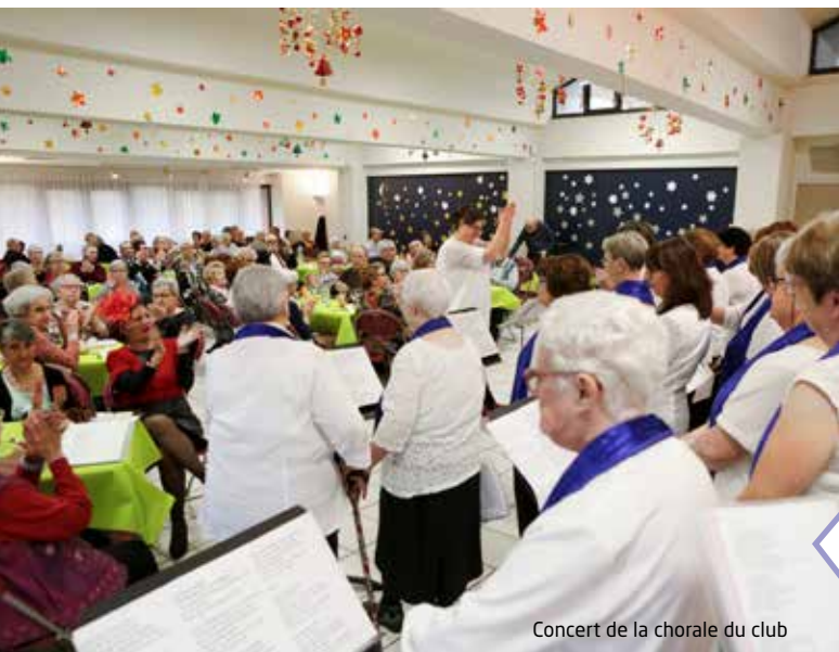
Concert de la chorale du club