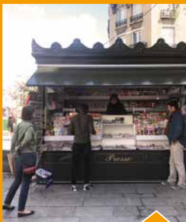
Le premier kiosque à journaux provisoire est ouvert sur le parvis de la Mairie.

Le jeu des 1000 euros, qui fête ses 60 ans, fait escale pour la première fois de son histoire aux Lilas.