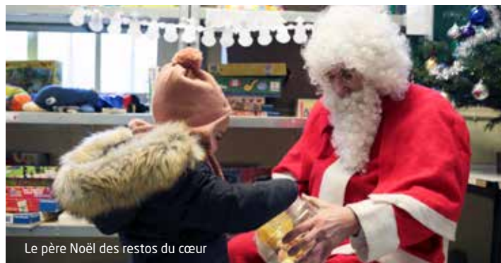
Le père Noël des restos du cœur

Associations solidaires très actives aux Lilas, le Secours populaire et les Restos du cœur multiplient les actions pour Noël.