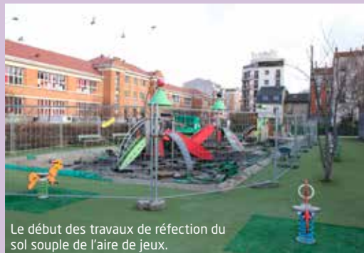
Le début des travaux de réfection du sol souple de l'aire de jeux.