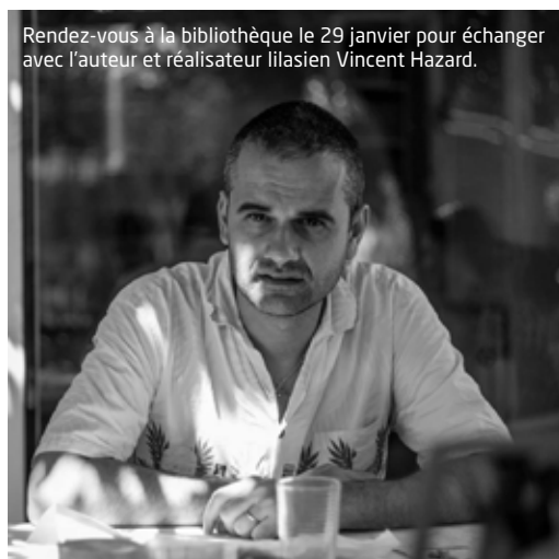
Rendez-vous à la bibliothèque le 29 janvier pour échanger avec l'auteur et réalisateur lilasien Vincent Hazard.

Encore plus de Lilasiens qui accueillent leurs voisins artistes, encore plus d'artistes lilasiens qui font découvrir leur univers, de nouveaux lieux associatifs qui participent : 2019 débute en fanfare !