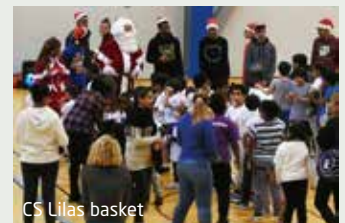
CS Lilas basket

De nombreuses associations sportives ont organisé un moment convivial pour fêter la fin de l'année.