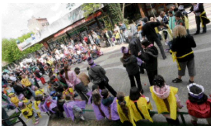
Les enfants du Centre de Loisirs à l'arrivée du défilé du mercredi 26 avril au quartier des Sentes.