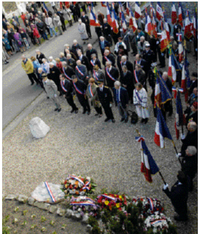
la journée nationale du souvenir et de la déportation le 29 avril au Fort de Romainville aux Lilas.

la réalisation de vêtements expérimentaux. Avec son Laboratoire de customisation textile, Sakina M'sa propose un véritable recyclage vestimentaire – toutes les sources sont des vêtements de seconde main collectés – mais aussi une confrontation des regards, des mémoires, des désirs et des récits inscrits dans le vêtement.