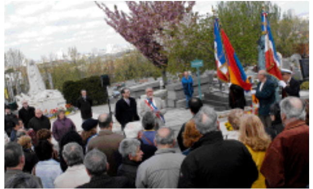
91 e anniversaire du génocide arménien, samedi 29 avril au cimetière.