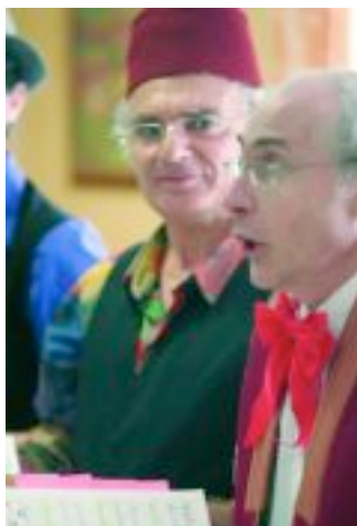
Atelier lyrique du Conservatoire, résidence Les Jardins des Lilas.

Fête de la musique 2006 : 251 musiciens étaient au rendez-vous. Moment privilégié pour restituer le travail fourni tout au long de l'année par ces apprentis, souvent confirmés.