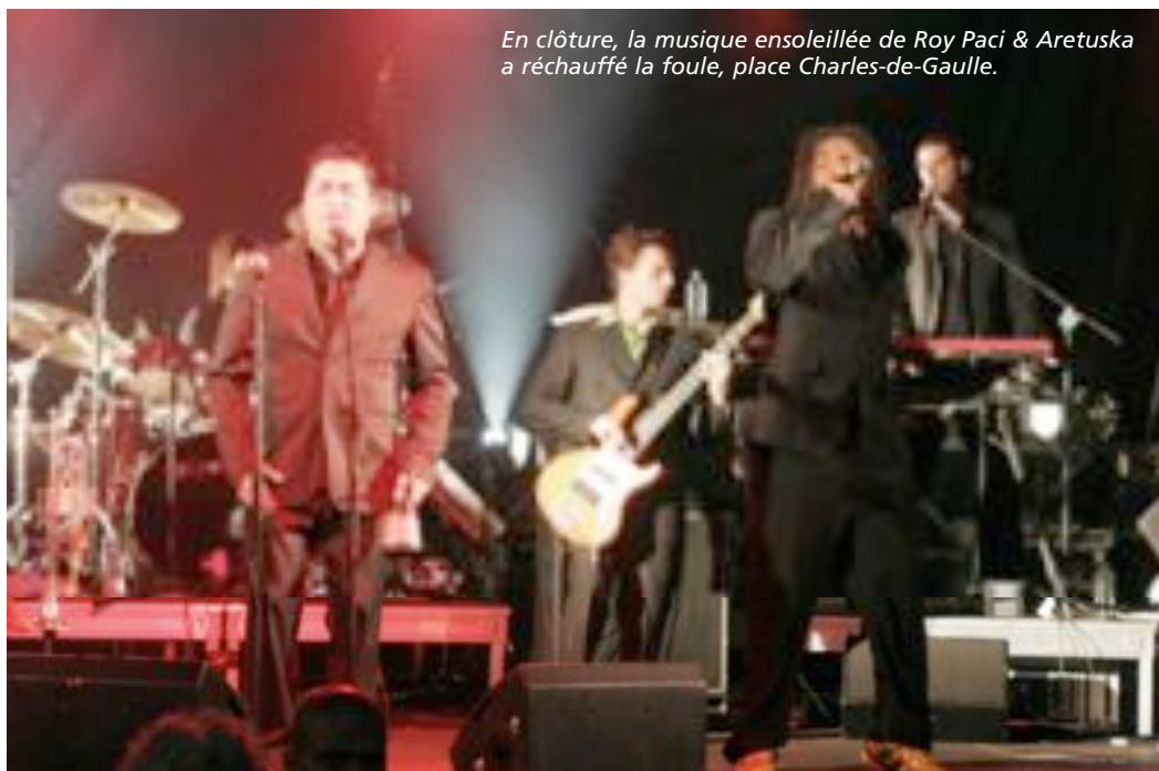
En clôture, la musique ensoleillée de Roy Paci & Aretuska a réchauffé la foule, place Charles-de-Gaulle.