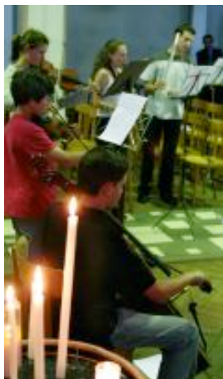
Musique de chambre, église Notre-Dame du Rosaire.