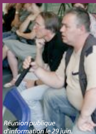
Réunion publique d'information le 29 juin.