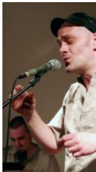
Frolo à Lilas en Scène.