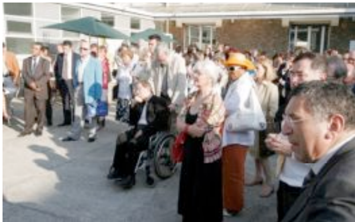
L'inauguration du PLIE a eu lieu le 29 juin, dans les locaux de l'association porteuse du dispositif à Pantin.

La Ville des Lilas vient de créer un nouveau dispositif de retour à l'emploi, en partenariat avec Pantin et Le Pré Saint-Gervais. Le PLIE (plan local d'insertion pour l'emploi) est destiné à renforcer la coordination des interventions locales existantes pour l'accès ou le retour à l'emploi des personnes les plus en difficulté.