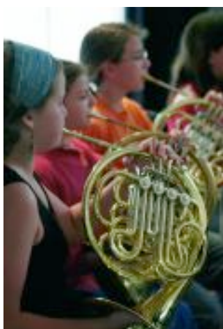
Classe de cors du Conservatoire, Club des Hortensias.

37 e édition de Cabaret, les 2, 3 et 4 juin, au Théâtre du Garde-Chasse.