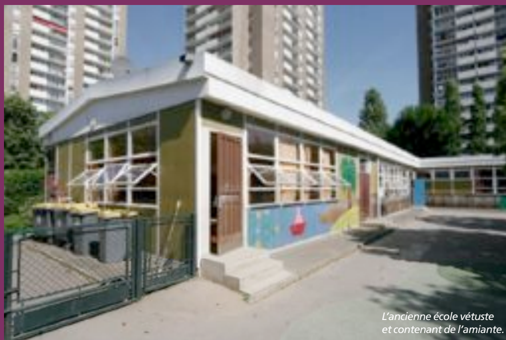
L'ancienne école vétuste et contenant de l'amiante.

■ Câble : travaux tout le mois de juillet rue de Paris et dans le quartier Charles-de-Gaulle. Pas de travaux au mois d'août.