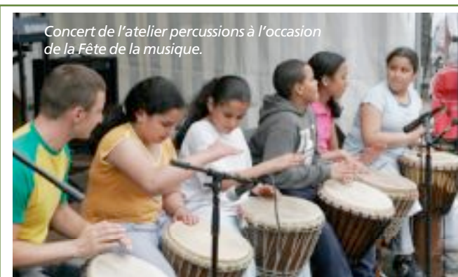
Concert de l'atelier percussions à l'occasion de la Fête de la musique.