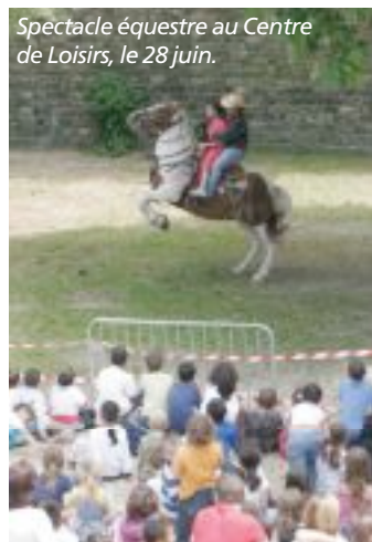
Spectacle équestre au Centre de Loisirs, le 28 juin.