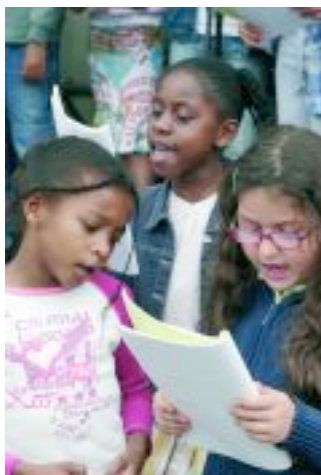
Chorale du Centre de Loisirs, esplanade du Centre Culturel.