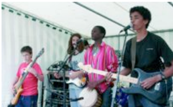
Another Paradise, résidence de l'Avenir.

37 e édition de Cabaret, les 2, 3 et 4 juin, au Théâtre du Garde-Chasse.