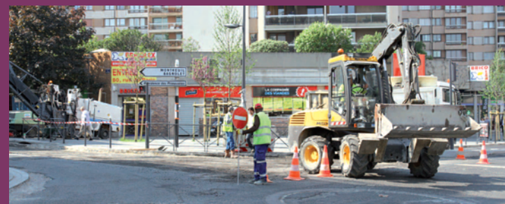
Début de l'aménagement du carrefour rue des Bruyères / rue de Paris / rue du Pré Saint-Gervais / rue F. Fromond.

Montant total des travaux : 4, 850 millions € (84 % département ; 16 % ville).