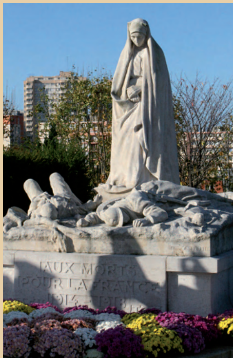
Monument aux morts du cimetière, œuvre du sculpteur Félix Desruelles, inauguré en 1925.

Guerre mondiale, avant d'être exterminés lors de la Seconde. Ils sont confrontés aux moments forts de cette période. Nos sorties les mettent en face de la réalité et je sais - pour en avoir discuté avec eux - qu'ils s'en souviennent bien des années plus tard. En 1998, pour le 80 e anniversaire de l'Armistice, nous avons même assisté aux cérémonies officielles, sous l'Arc de triomphe.