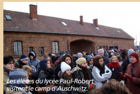
Les élèves du lycée Paul-Robert visitent le camp d'Auschwitz.

M.O. : C'est « le convoi des 31 000 » (elles seront immatriculées dans la série des « 31000 » entre les numéros 31625 et 31854). Nous étions en hiver, le sol était gelé, jonché d'excréments. Nous sentions les corps en train de brûler dans les crématoires et avions en face de nous des cadavres faméliques, nus, empilés les uns sur les autres. Nous avons compris que nous étions en enfer. Parmi les pre-