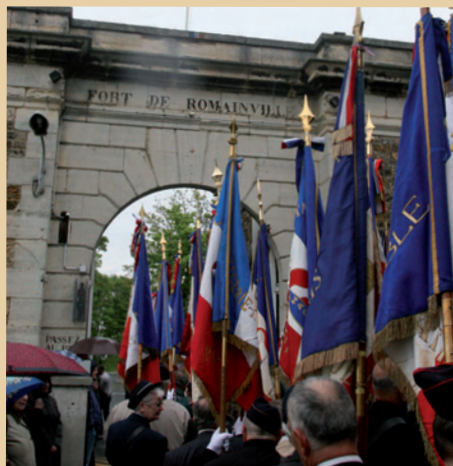
Le Fort dit « de Romainville » : le maire des Lilas souhaite que soit réalisé en son sein, un Mémorial national dédié au souvenir des femmes dans la Résistance et la déportation.

C'est un objectif à long terme du Comité d'entente. Nous essayons de recruter des « Opex » (militaires en opérations extérieures), des jeunes, à travers lesquels la mémoire continuera d'exister. La vocation du Comité d'Entente, c'est aussi d'anticiper car la mémoire doit perdurer au-delà de la disparition des combattants des générations précédentes.