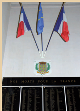
Liste des 545 Lilasiens tombés au champ d'honneur, gravée dans le marbre au pied du grand escalier de la mairie.

J. S. : Bien sûr. Nous étudions d'abord en classe puis, sur place, les élèves peuvent voir de près à quoi ressemble une tranchée, ils visitent un cimetière militaire et découvrent des tombes de soldats Juifs dans le cimetière allemand. Contrairement au discours des nazis, des Juifs ont donc combattu dans l'armée allemande pendant la Première