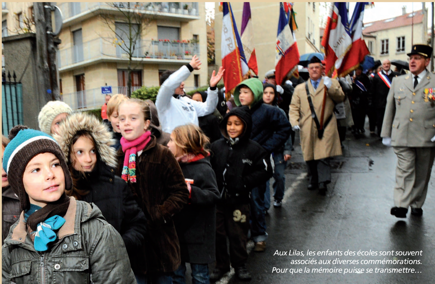
Aux Lilas, les enfants des écoles sont souvent associés aux diverses commémorations. Pour que la mémoire puisse se transmettre...