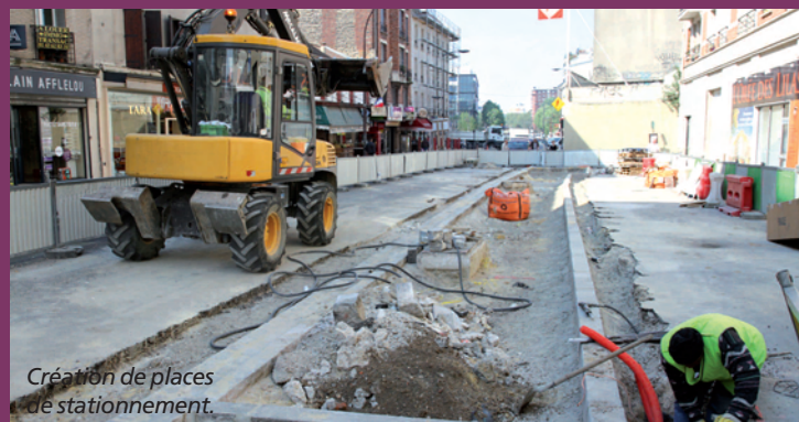
Création de places de stationnement.

Les phases 1 et 2 sont en voie d'achèvement. La 3 e phase concerne le tronçon compris entre la rue Francine-Fromond et la rue Jean-Moulin. Les trottoirs vont être agrandis. Entre la rue des Bruyères et la rue Georges-Pompidou, des places de stationnement et de livraison sont prévues des 2 côtés. Un nouveau carrefour avec des feux sera installé à l'intersection de la rue de Paris et du Coq français. Fin des travaux : début juillet. Le double sens sera alors rétabli sur l'ensemble de la rue.