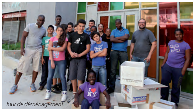
Jour de déménagement.

Le service jeunesse a été le premier à investir le nouvel Espace Louise-Michel. Dès le 30 juillet, les animateurs et les jeunes étaient à pied d'œuvre. La halte garderie et le centre culturel profiteront des nouveaux locaux dès la rentrée.