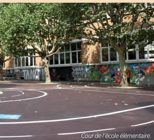
Cour de l'école élémentaire.

Les cours des écoles Romain-Rolland (la crèche, mais aussi par la création du terrain de la maternelle et le collège et le lycée. L'année scolaire 2012-2013 de l'école maternelle des Bruyères.