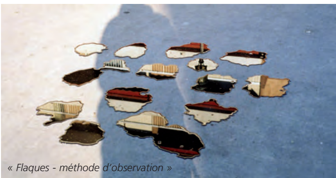
« Flaques - méthode d'observation »

Espace Khiasma - 15, rue Chassagnolle Tél. : 01 43 60 69 72.