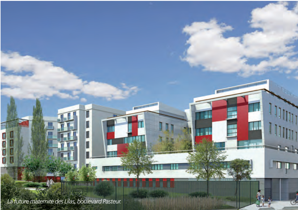
La future maternité des Lilas, boulevard Pasteur.

L'association « Naissance », qui régit la Maternité des Lilas, a finalisé ses discussions avec d'autres partenaires : tout en préservant son identité et restant maîtresse de son projet médical, la Maternité des Lilas sera désormais adossée médicalement à l'Hôpital Robert Debré et administrativement au groupe Diaconesses-Croix Saint-Simon.