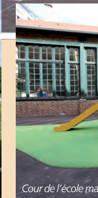
Cour de l'école ma