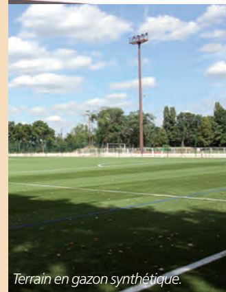
Terrain en gazon synthétique.