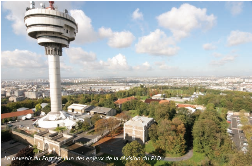
Le devenir du Fort est l'un des enjeux de la révision du PLU.