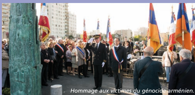
Hommage aux victimes du génocide arménien.