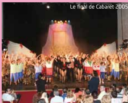
Le final de Cabaret 2005