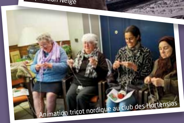
Animation tricot nordique au club des Hortensias