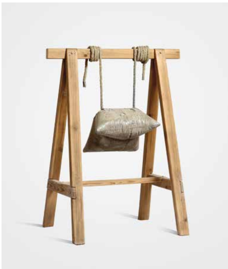
Tréteau II, 2012

Bois, ciment et corde, 122 x 92,5 x 67 cm