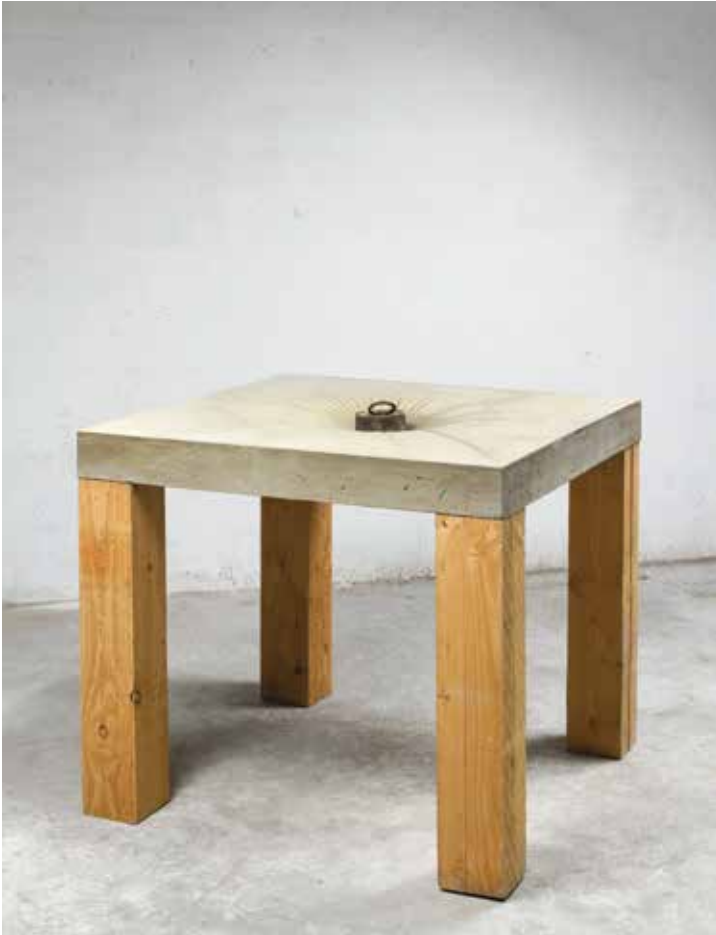
Sans titre (Etabli), 2014

Ciment, bois et poids en métal, 92 x 104 x 104 cm