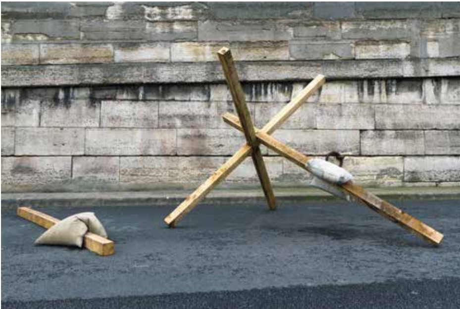
Sans titre (4 poutres / 2 sacs), 2013 Bois et béton, ca. 162 x 380 x 240 cm