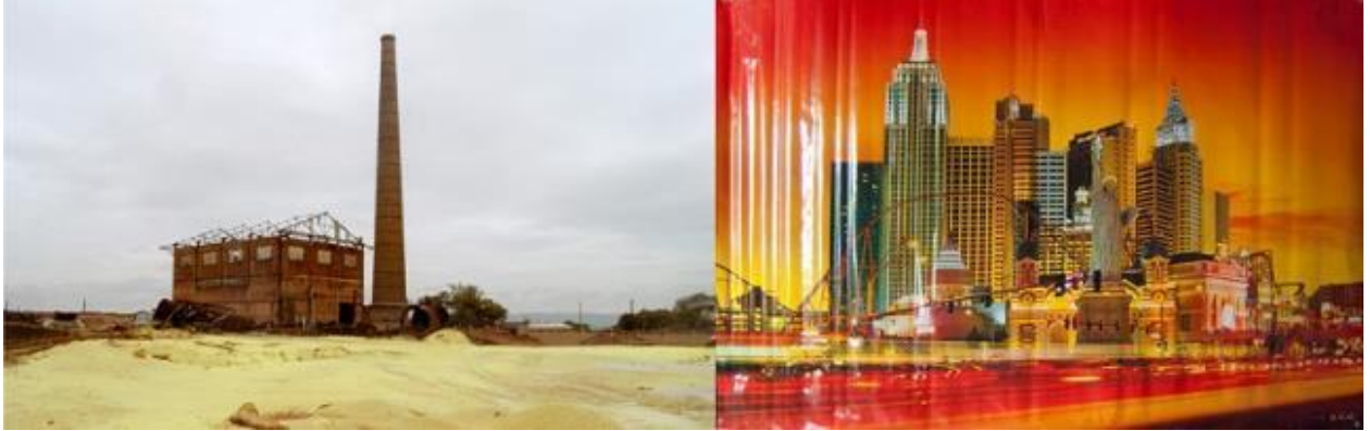
Raccord #7, Usine de Shituru , Sammy Baloji, impression jet d'encre sur papier baryté, 80 x 253,96 cm, 2012