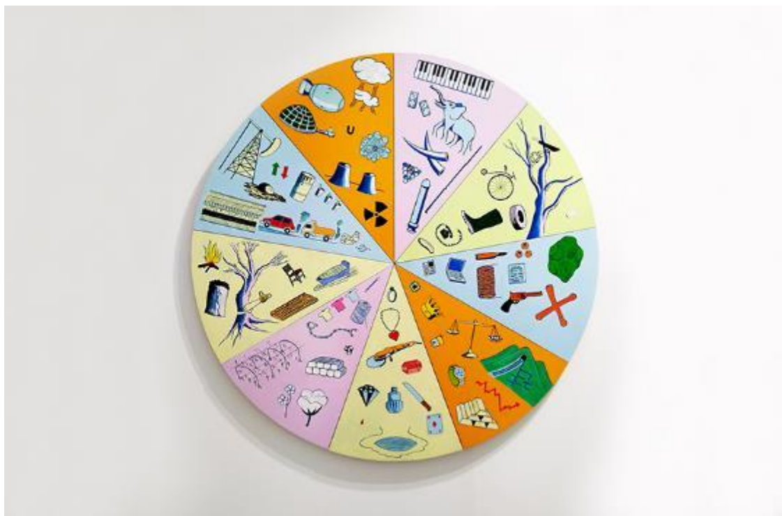
Ils ont partagé le monde , Maarten Van Eynde, acrylique et huile sur carton, 9 x (60 x 40 x 3,5 cm), 2017