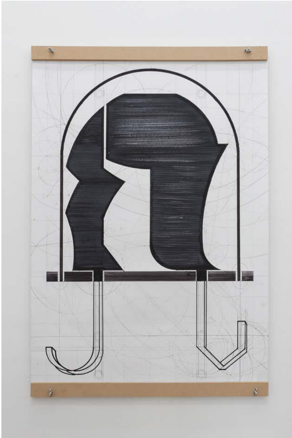
Afolampe , Jean Katambayi, Dessin, bic et marqueur sur papier, 100 x 70 cm, 2016