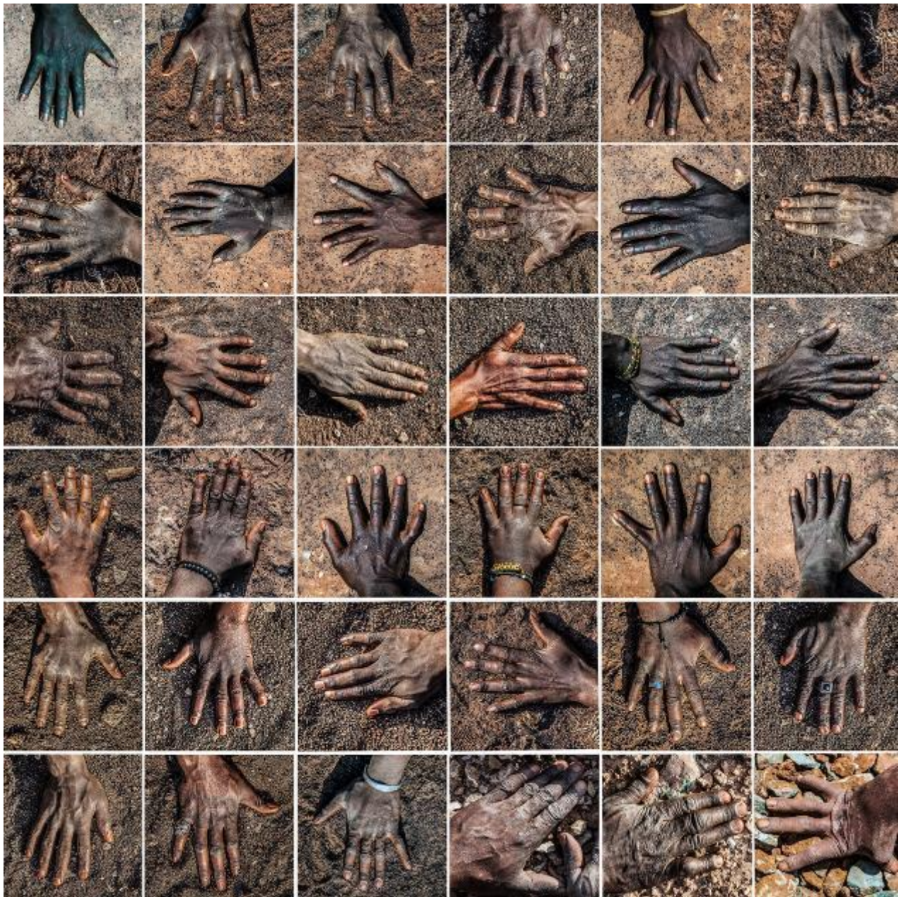
Le Vide , Georges Senga, photographie numérique, 200 x 200 cm, 2019 © Georges Senga Courtesy de l'artiste