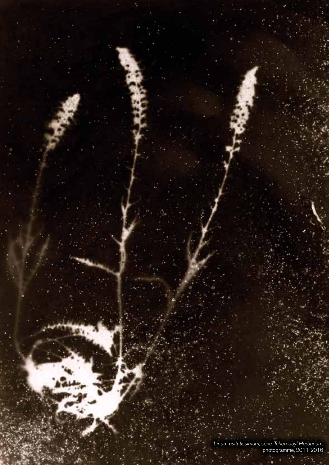
Linum usitatissimum , série Tchernobyl Herbarium , photogramme, 2011-2016