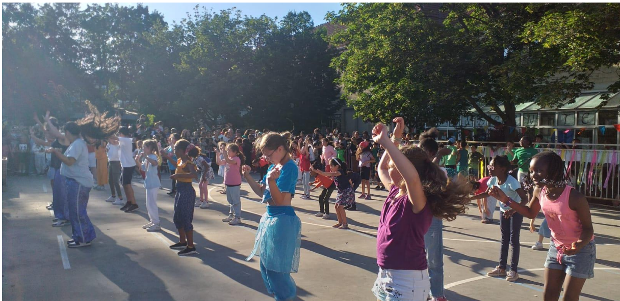
Danse du périscolaire lors de la kermesse de fin d'année

Le résultat final a été présenté à la fête de l'école. Cette visibilité a suscité l'envie de participer chez d'autres enfants pour l'année prochaine.