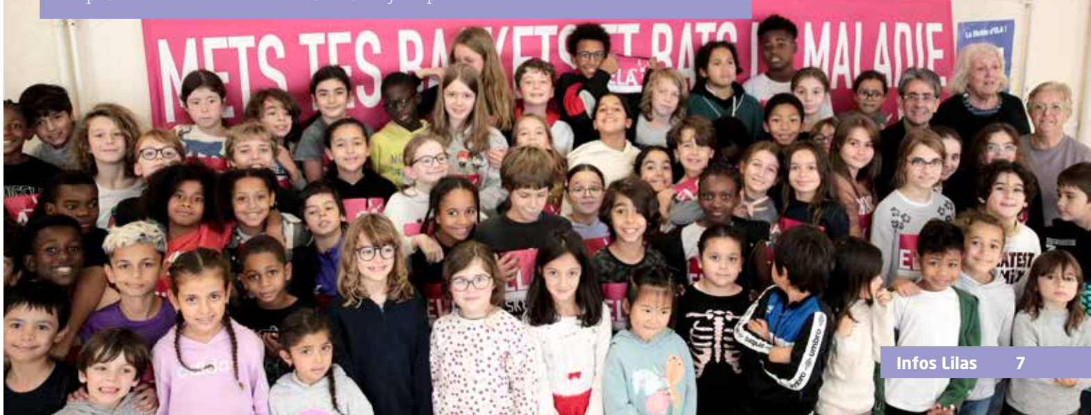
Les élèves ayant participé à la dictée

L'école Waldeck-Rousseau a accueilli une nouvelle édition de la dictée de l'association ELA pour sensibiliser les élèves aux leucodystrophies.