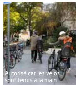
Autorisé car les vélos sont tenus à la main

Le cycliste est d'autant plus en danger qu'il partage souvent la voie avec les automobilistes. Pour rendre son cheminement plus sécurisé, la Ville crée des pistes cyclables en site propre mais cela ne sera pas possible dans toutes les rues des Lilas. Rappelons qu'une voiture doublant un vélo doit laisser un écart confortable d'un mètre en ville et qu'il faut être particulièrement prudent : regarder ses rétroviseurs lorsque l'on tourne, double ou change de file. Des recommandations valables aussi pour protéger les motard-es.