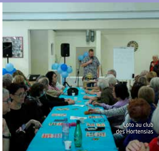
Loto au club des Hortensias