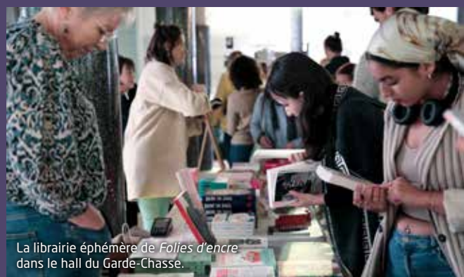
La librairie éphémère de Folies d'encre dans le hall du Garde-Chasse.