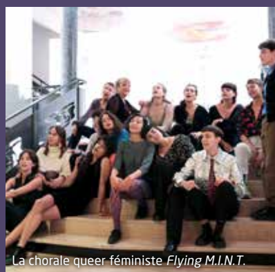
La chorale queer féministe Flying M.I.N.T.