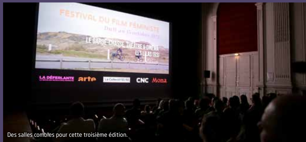
Des salles combles pour cette troisième édition.

11 au 15 octobre : une très belle 3 ème édition du Festival du film féministe Cette édition avait choisi de questionner les injonctions. Cinq jours de projections, de débats, de dédicaces, de spectacles, de découvertes pour le très nombreux public. Vivement la prochaine édition !