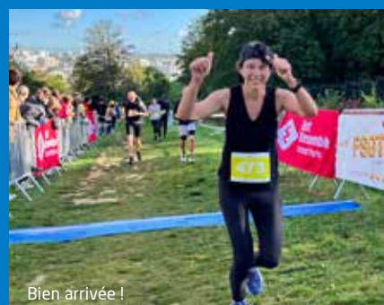
Bien arrivée !