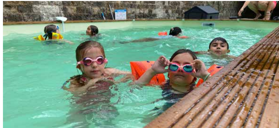
L'été au Centre de loisirs

100% des équipes formées à la prévention des violences et à l'éducation bienveillante