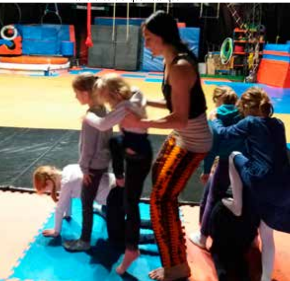
Atelier avec le Cirque Electrique