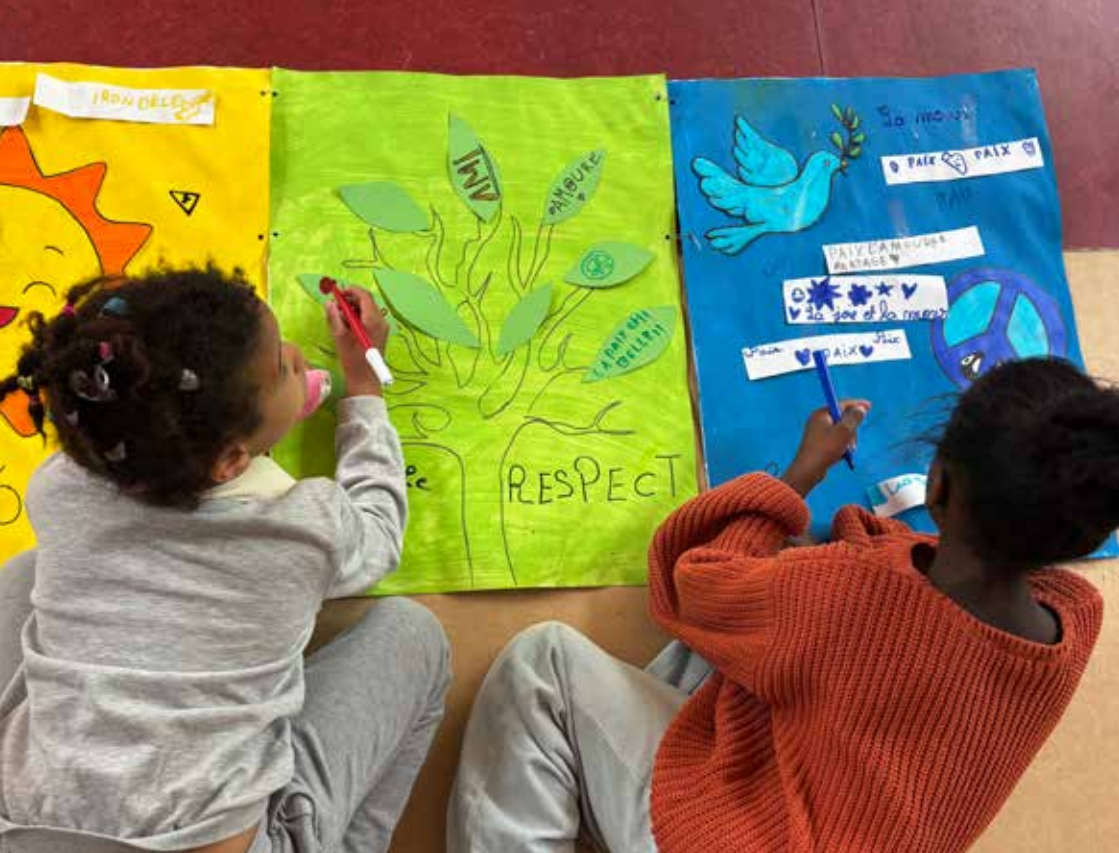
Préparation de la Journée des droits de l'enfant