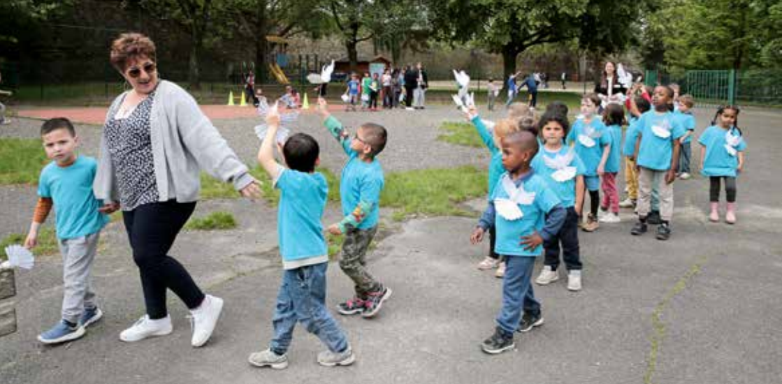
Journée Uniday au Centre de loisirs