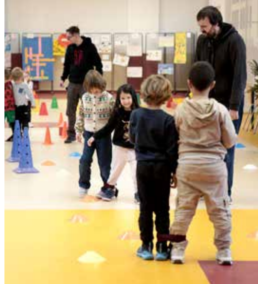
Atelier de sensibilisation au handicap