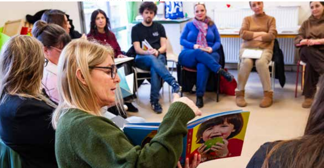
Formation des animatrices et animateurs à la lecture pour les jeunes enfants

100 % des agent·es formé·es à la prévention des violences et maltraitements envers les enfants 100 % sensibilisé·es à l'égalité filles-garçons 97 % formé·es à l'autorité bienveillante