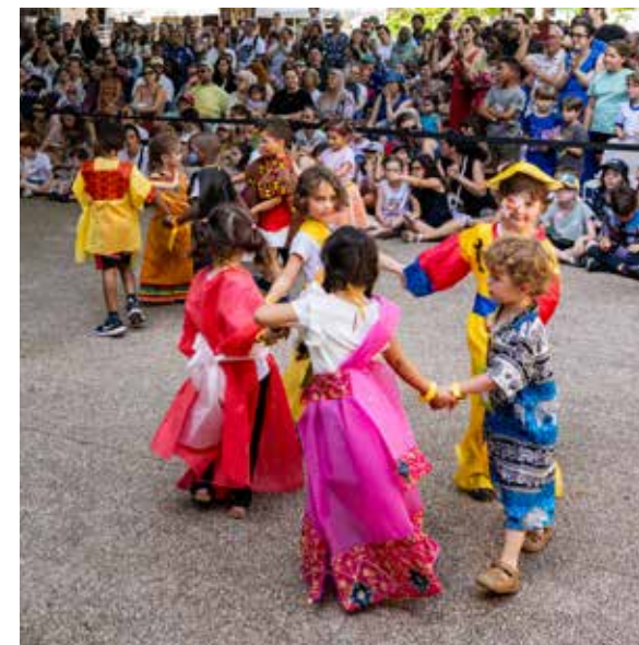
Kermesse du centre de loisirs

« Des activités encadrées par une équipe d'animation qualifiée et diplômée »